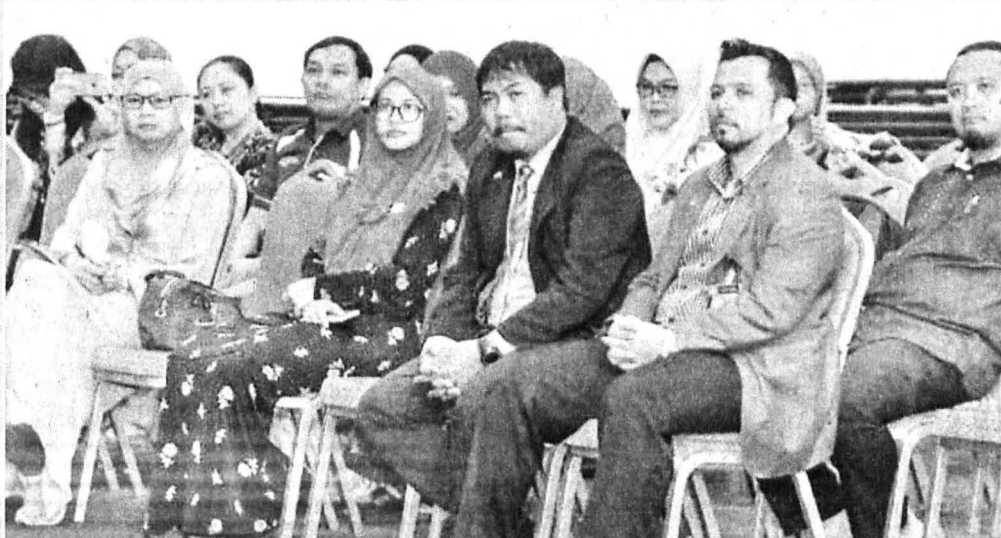
(Gambar bawah) ANTARA alumni kakitangan UMS yang hadir.