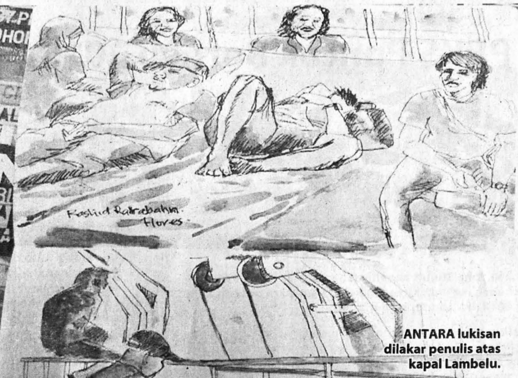
ANTARA lukisan dilakar penulis atas kapal Lambelu.

***PENULIS merupakan Pensyarah Seni Visual, Fakulti Kemanusiaan, Seni dan Warisan di Universiti Malaysia Sabah (UMS).***