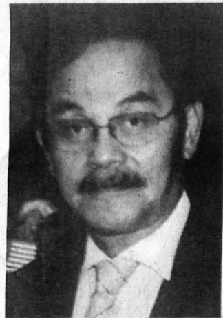
CATATAN KANVAS KOYAK