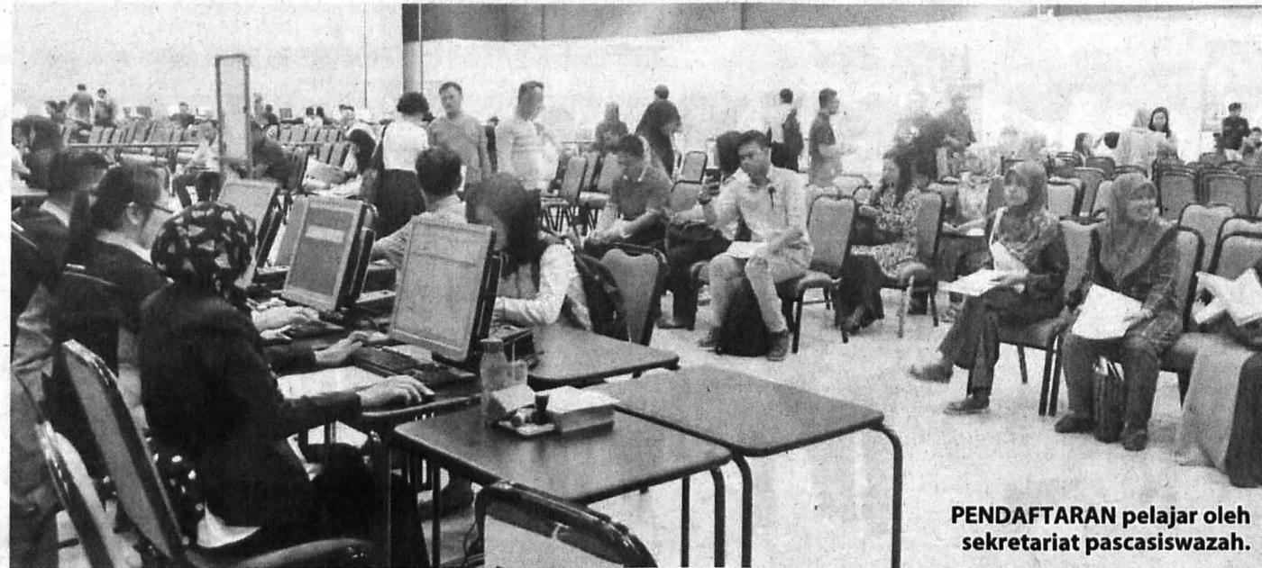
PENDAFTARAN pelajar oleh sekretariat pascasiswazah.