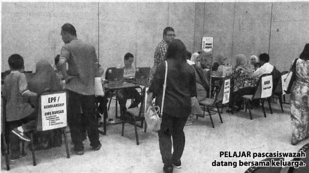
PELAJAR pascasiswazah datang bersama keluarga.

tambah beliau, para pelajar akan mengikuti sesi suai kenal dengan fakulti dan pusat penyelidikan masing-masing.