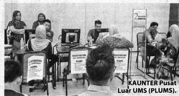
KAUNTER Pusat Luar UMS (PLUMS).