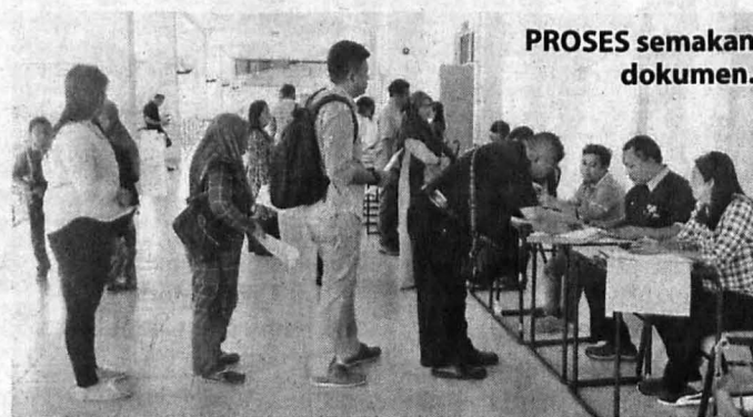
PROSES semakan dokumen.