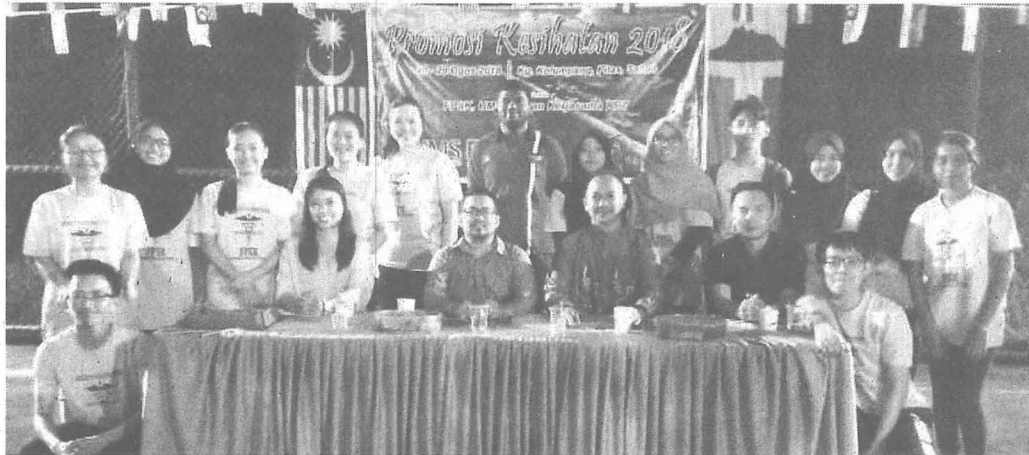
BERGAMBAR kenangan bersama pelajar yang terlibat.

► Anjuran KRT Kg. Kalumpang dengan kerjasama Fakulti Perubatan Dan Sains Kesihatan UMS