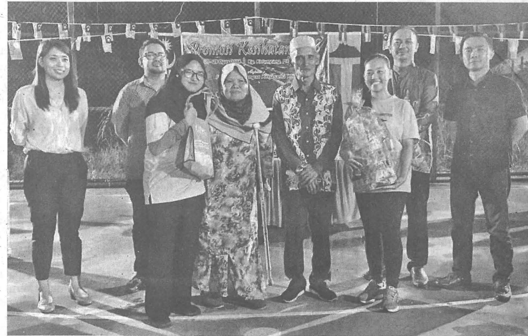
SESI bertukar-tukar hadiah salah satu keluarga angkat.

dilaksanakan sepanjang program tersebut berlangsung ialah sukaneka, pemeriksaan kesihatan, gotong-royong, ceramah kesihatan, kunjungan