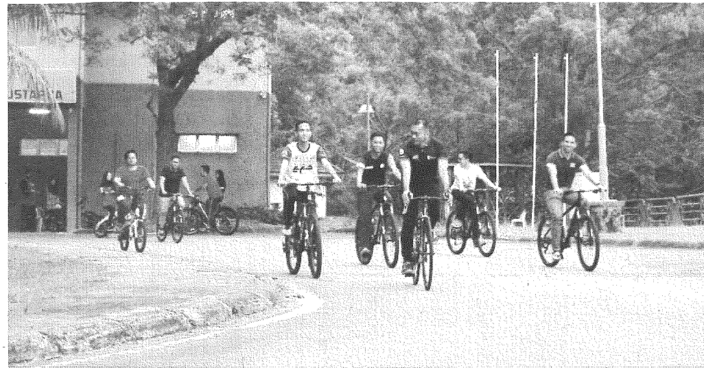
AHLI Kelab Berbasikal KKTM mulakan acara berbasikal.

Di samping itu, aktiviti ini boleh melancarkan aliran darah yang mampu meningkatkan daya ingatan dan konsentrasi seseorang kerana pengumpulan toksin dalam badan dihalang.