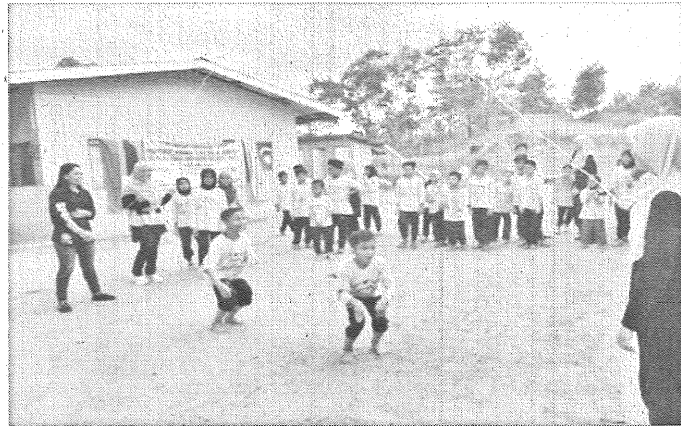
ANTARA permainan yang dijalankan semasa program Generasi Muda Bebas Rasuah.

“Rasuah bukan sahaja dilakukan oleh orang dewasa malahan juga harus dipupuk dengan generasi muda agar dapat meningkatkan kesedaran dari awal.”