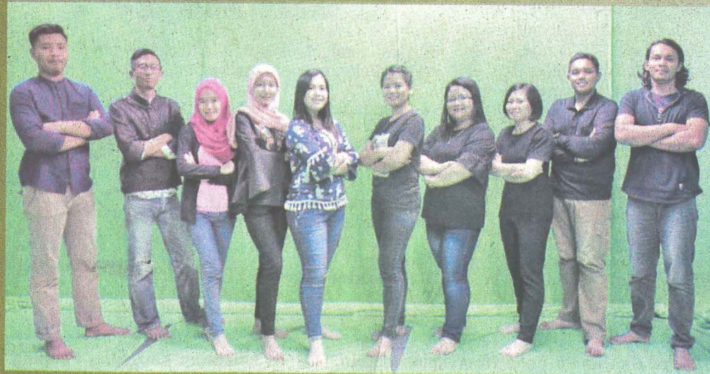
KRU produksi Starwolf Studio.

Antara lokasi penggambaran filem ini banyak dilakukan di sekitar hutan yang terdapat di UMS dan Tegudon Tourism Village, Kota Belud.