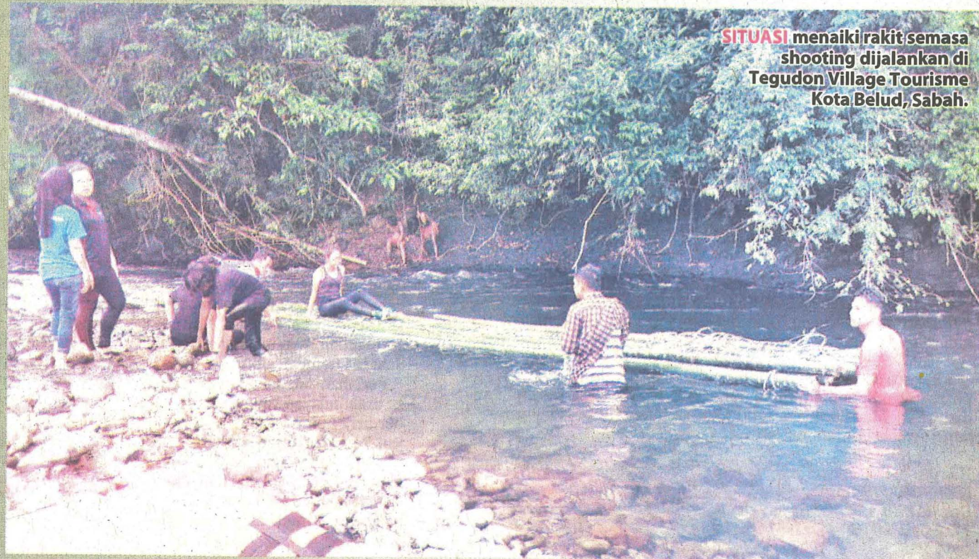
SITUASI menaiki rakit semasa shooting dijalankan di Tegudon Village Tourisme Kota Belud, Sabah.

Sebagai "Cameraman" bukan sesuatu yang mudah. mengambil shot yang menarik adalah sesuatu yang sangat mencabar cameraman. Dalam setiap scene ada pelbagai shot