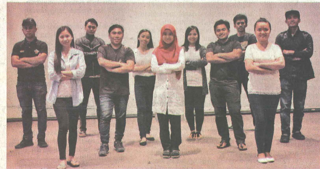
11 tenaga produksi untuk filem ini.

Walaubagaimanapun, kesemua 11 orang ahli pada produksi ini menjadikan pengalaman ini bermakna malah perjuangan mereka tidak terhenti hanya sekadar kerja subjek wajib di universiti sahaja. Mereka juga akan memperjuangkan dan meluaskan legasi produksi mereka bukan hanya di dalam negeri Sabah ini tetapi di peringkat kebangsaan.