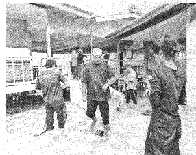
SUKARELAWAN bersama-sama penduduk kampung membersihkan kawasan perkarangan masjid Kampung Taun Gusi Batu 4.

Selain itu, aktiviti malam kebudayaan juga turut diadakan bersama penduduk kampung di mana pelbagai budaya dan adat yang dipersembahkan.