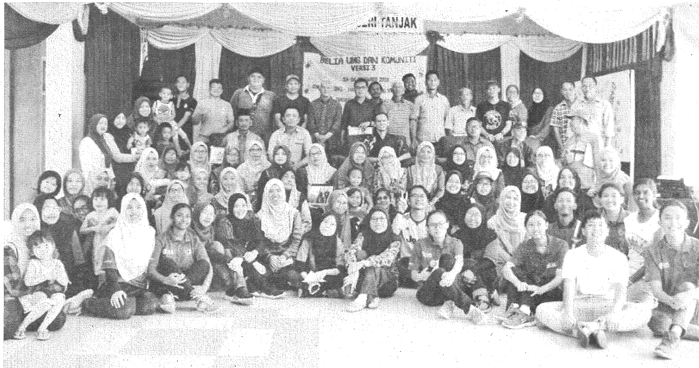
SUKARELAWAN terlibat merakam gambar kenangan bersama Panil Kota dan penduduk kampung.

Program sukarelawan di bawah Kelab Sukarelawan Siswa (KESUWA) UMS ini lebih memberikan fokus