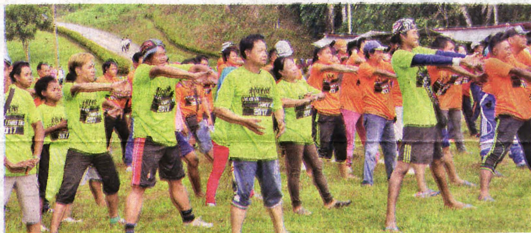
PEKERJA-PEKERJA KTSP bersemangat ketika mengikuti aktiviti senaman aerobik.