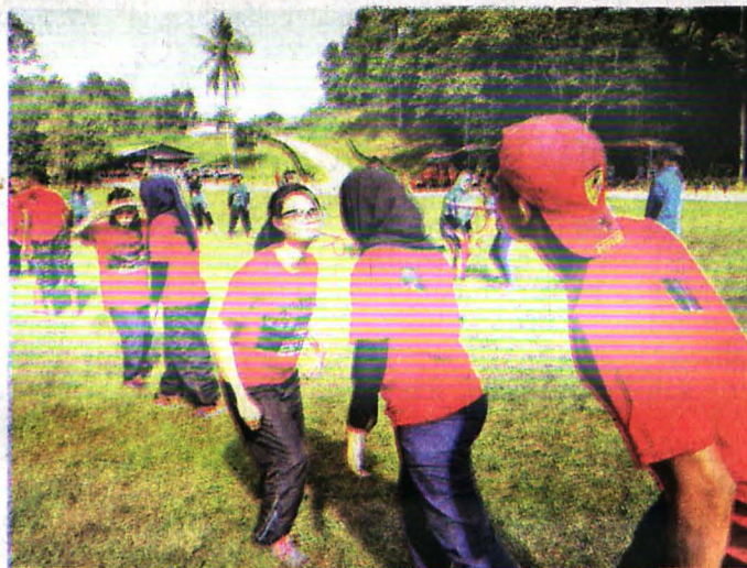
SALAH satu daripada permainan sukaneka yang diadakan.