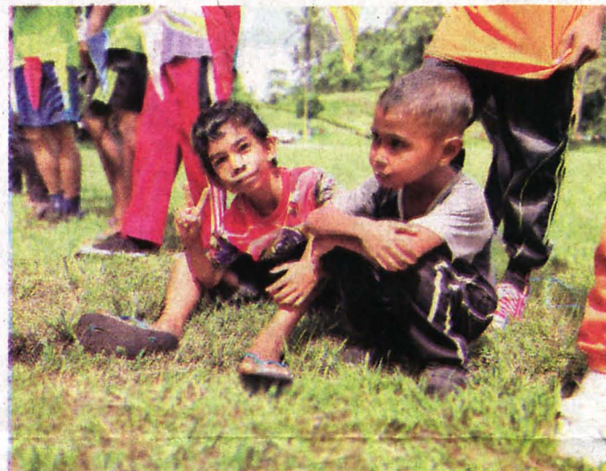
ANAK-ANAK kepada pekerja KTSP turut serta dalam acara itu.

Acara tahunan ini diakhiri dengan jamuan malam penghargaan dan dihiburkan dengan persembahan daripada para pekerja.