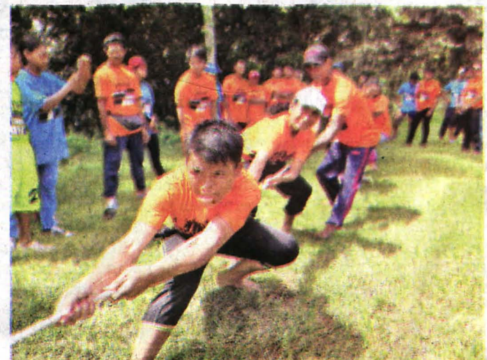
PESERTA sedia untuk acara tarik tali.