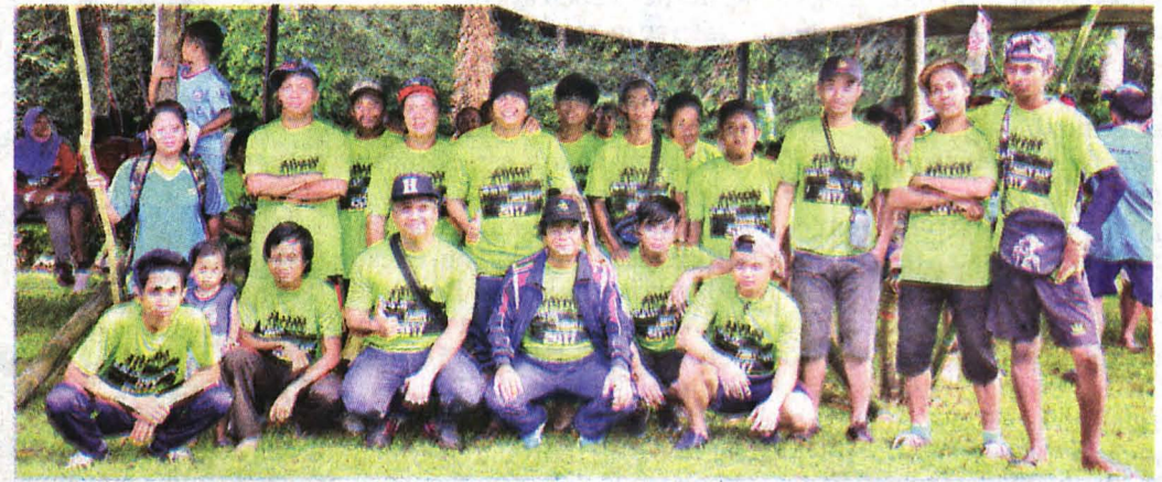
KUMPULAN Hijau muncul juara keseluruhan Hari Keluarga KTSP 2017.

Antara pencapaian membanggakan adalah Anugerah Perdana Menteri Hibiscus bagi Pencapaian Ketara dalam Pengurusan Alam Sekitar.