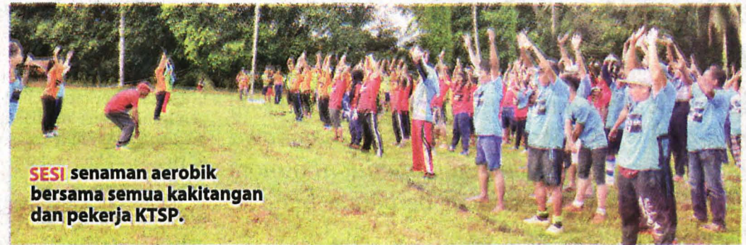
SESI senaman aerobik bersama semua kakitangan dan pekerja KTSP.

KTSP adalah perintis FMU (Unit Pengurusan Hutan) yang dianugerahkan dengan dua pensijilan, ISO 14001:2004 (Sistem Pengurusan Alam Sekitar)