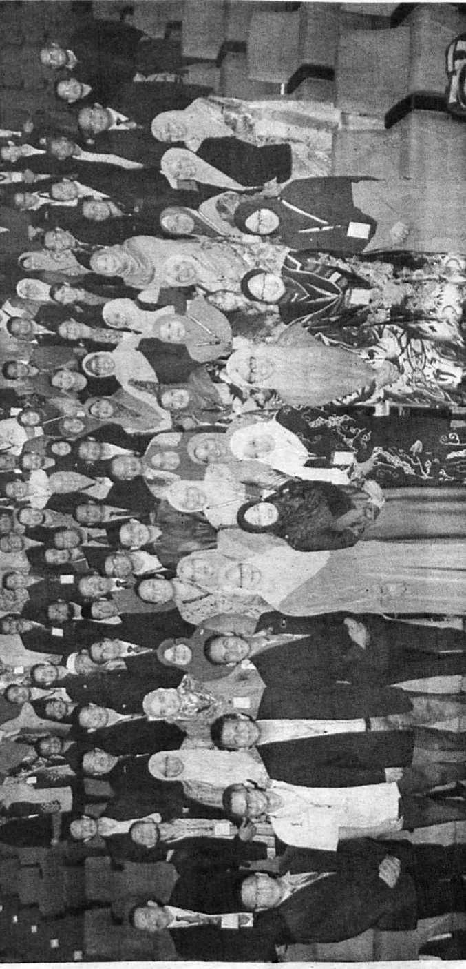
KU Azmi merakam kenangan bersama peserta Konvensyen Kepimpinan Perdana di Akept.