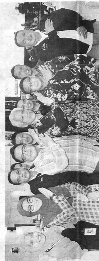
AHLI Kesatuan Kakitangan Am dari UMS gembira dapat bergambar bersama Idris Jusoh.