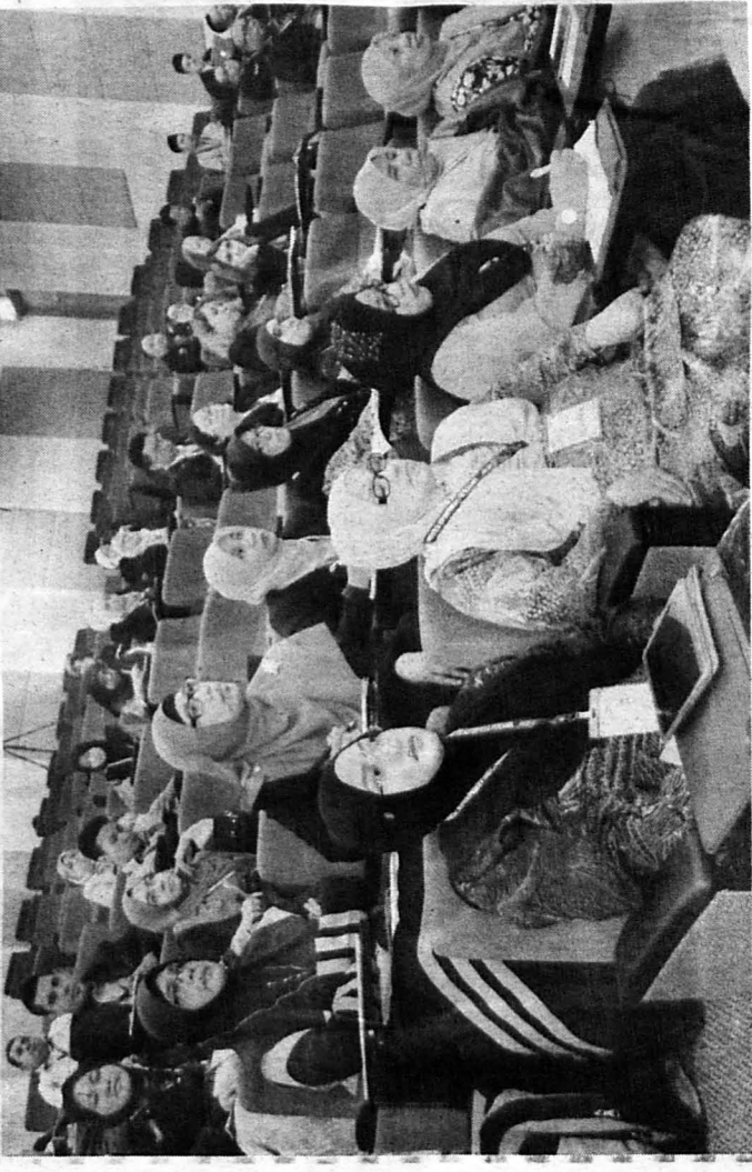
PEPERTA dari 20 universiti awam mendengar dengan tekun pembentangan kertas kerja tokoh ilmu negara.