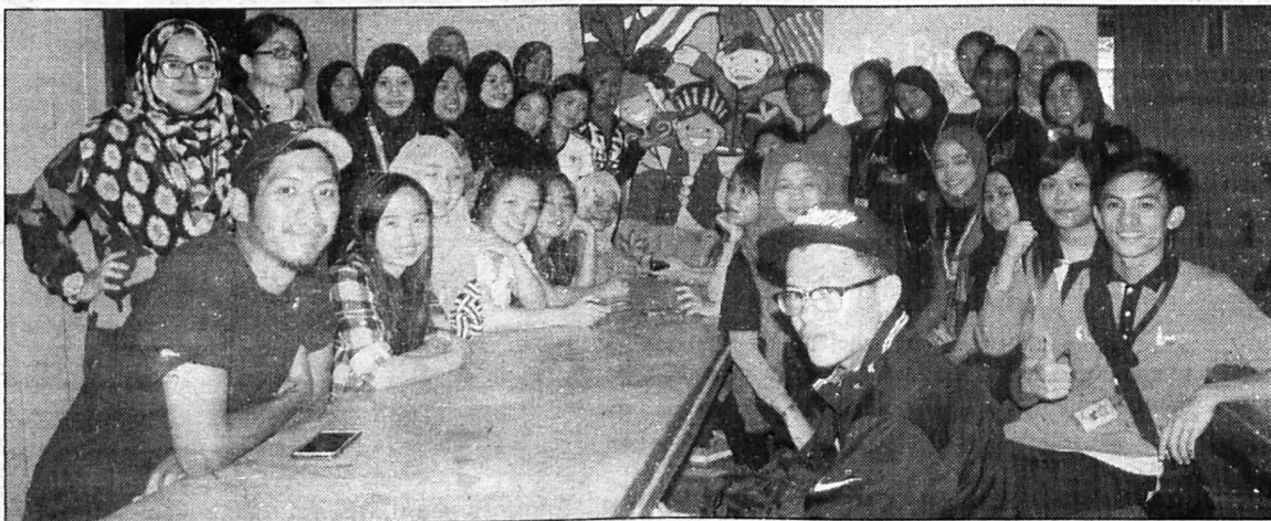
PARA pelajar INTERIM UMS bergambar dihadapan pintu masuk Perpustakaan Mini Kampung Baru Jumpa, Tenom.

"Kami berasa amat bertuah menerima kunjungan delegasi UMS yang telah bertungkus lumus menganjurkan pelbagai aktiviti serta membina sebuah perpustakaan mini di sini kerana perpustakaan memainkan peranan yang sangat penting dalam memupuk budaya membaca dalam kalangan anak-anak kecil dan amat berterima kasih kepada UMS atas sumbangan yang telah diberikan," tambahnya lagi.