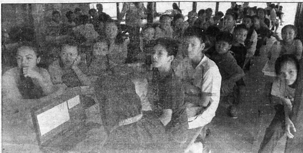
• AKTIVITI Klinik Bahasa Inggeris sedang dijalankan.