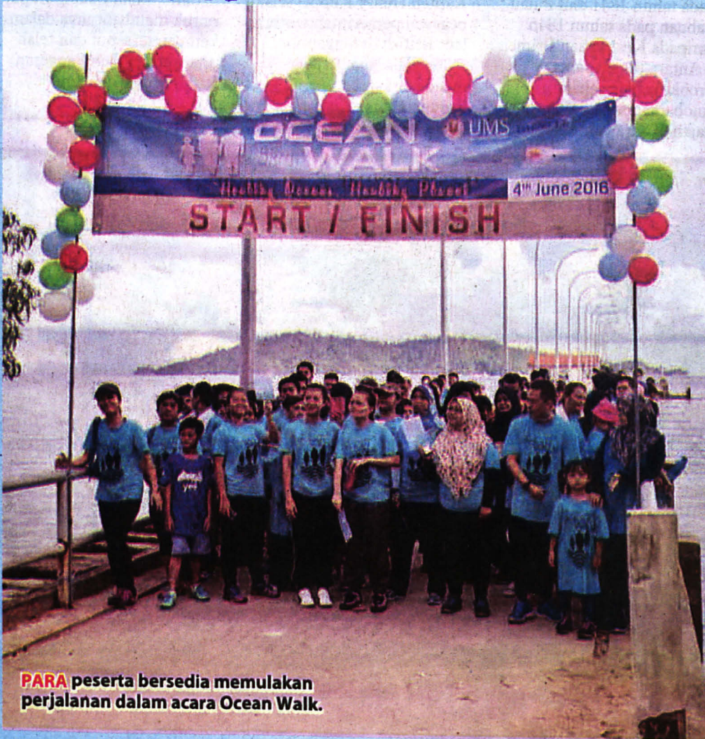
PARA peserta bersedia memulakan perjalanan dalam acara Ocean Walk.

SERAMAI 228 orang menyertai program Ocean Walk dan Kempen Kesedaran Awam tentang Perubahan Iklim dan Pemanasan Global yang dikendalikan oleh Institut Penyelidikan Marin Borneo (IPMB) Universiti Malaysia Sabah (UMS) bermula 26 Mei hingga 4 Jun lepas bertempat di Institut berkenaan.