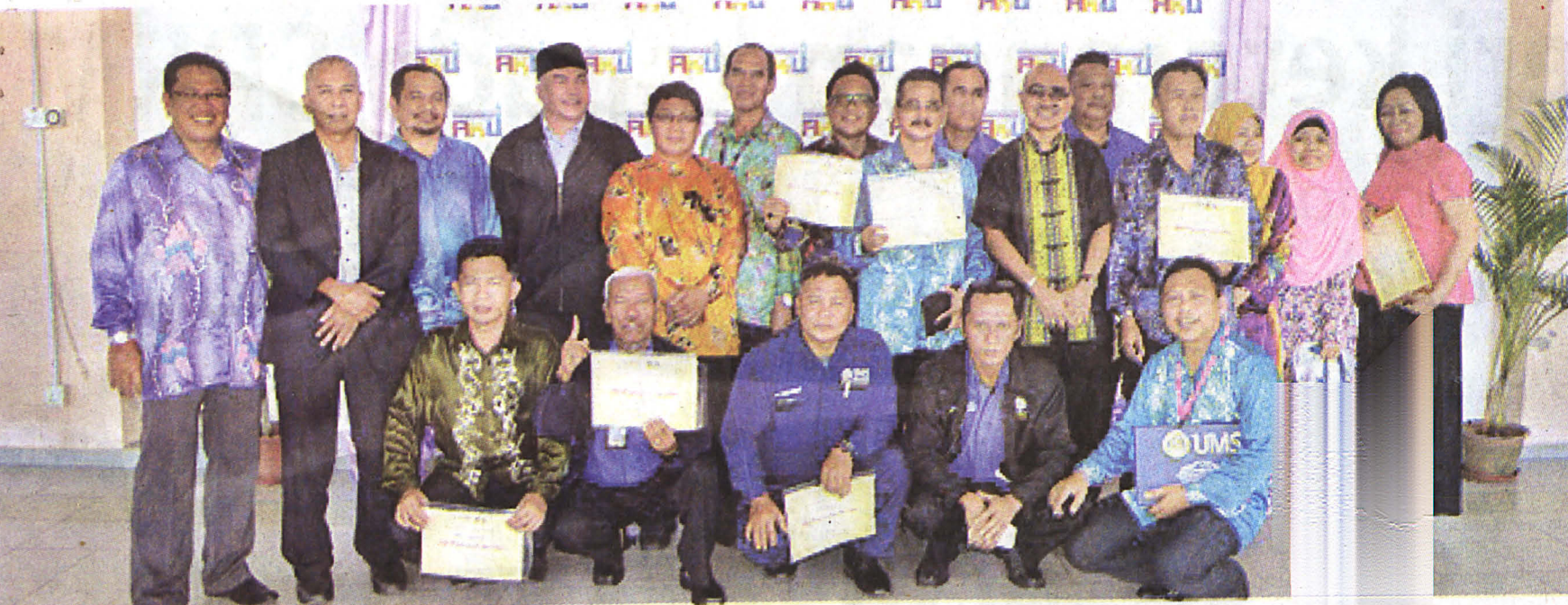
SEBAHAGIAN penerima Anugerah Jasa Setia 2015 bangga menerima anugerah itu.