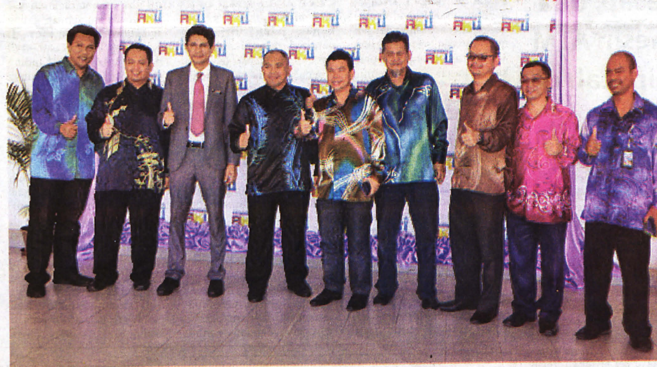
PEGAWAI kanan turut menerima Anugerah Jasa Setia 2015.