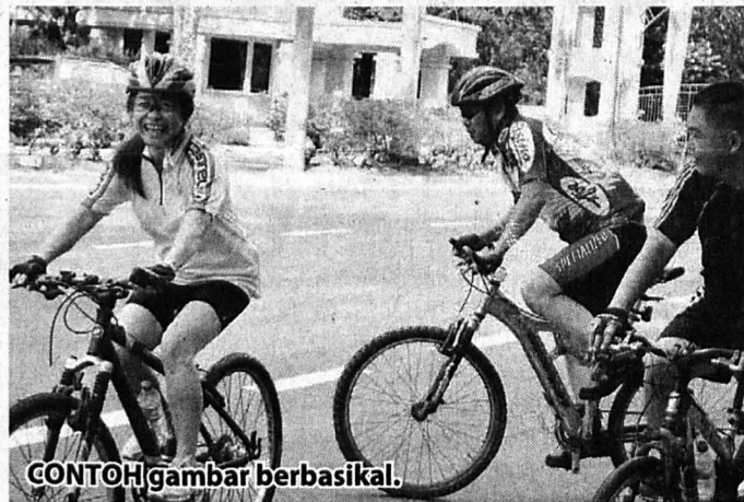
CONTOH gambar berbasikal.

Pada masa yang sama, pihaknya turut mengucapkan penghargaan dan terima kasih kepada semua yang terlibat secara langsung mahupun tidak langsung dalam memastikan program ini ke landasan yang tepat.