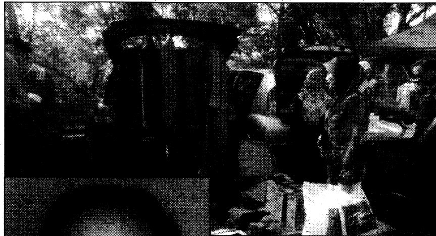
JUALAN... Sekitar Car Boot Sale FPEP UMS.