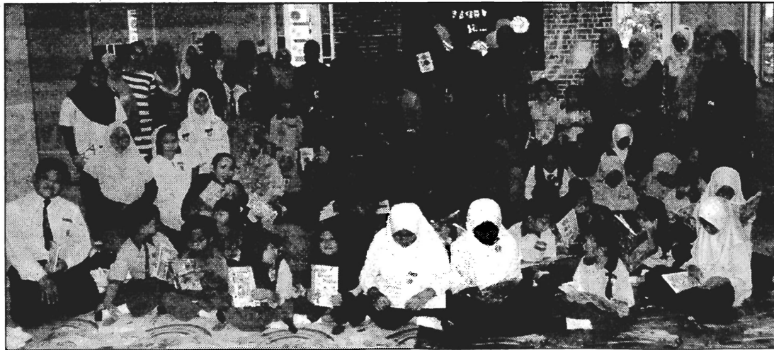
JOM BACA ... Sebahagian murid yang menjayakan program Jom Baca 10 minit di Perpustakaan UMS Labuan, kelmarin.

batan Pendidikan Wilayah Persekutuan Labuan.