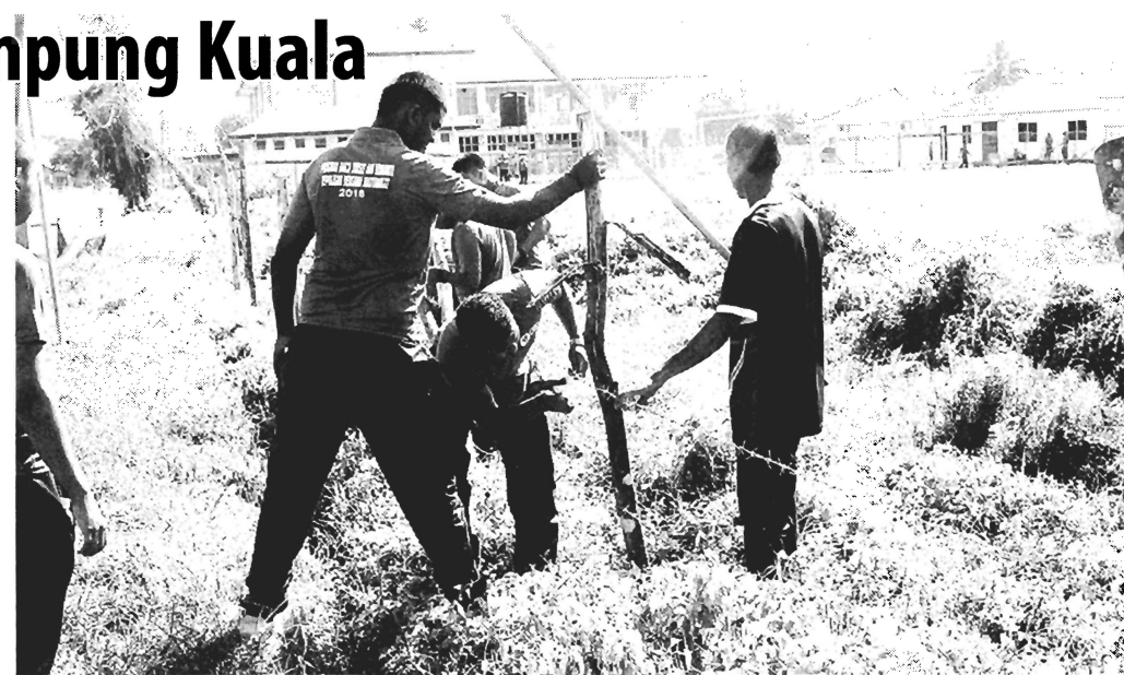
GOTONG royong perdana Pasukan Kor Suksis UMS bersama penduduk Kampung Kuala, Papar.

Papar, serta komuniti kampung yang turut bersama-sama terlibat sepanjang program itu berjalan.