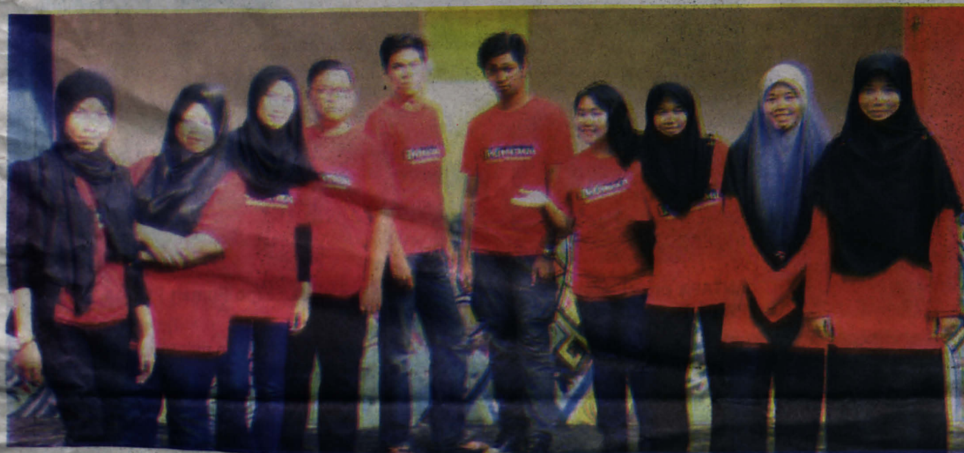
KREW produksi merangkumi empat kursus.