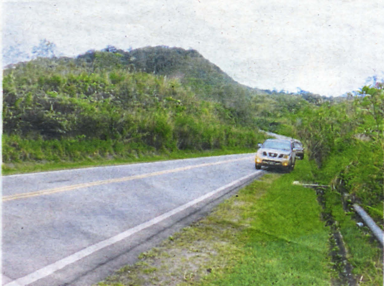
Ujian tarikan graviti menggunakan kenderaan pacuan empat roda.

Hamparan sepanjang 14km di Lembah Jin itu dilihat seperti mendatar atau mendaki, tetapi ia sebenarnya menurun atau condong. Ilusi optik berlaku disebabkan gunung di sekitar kawasan itu lebih menonjol dan mengaburi hamparan yang menurun.