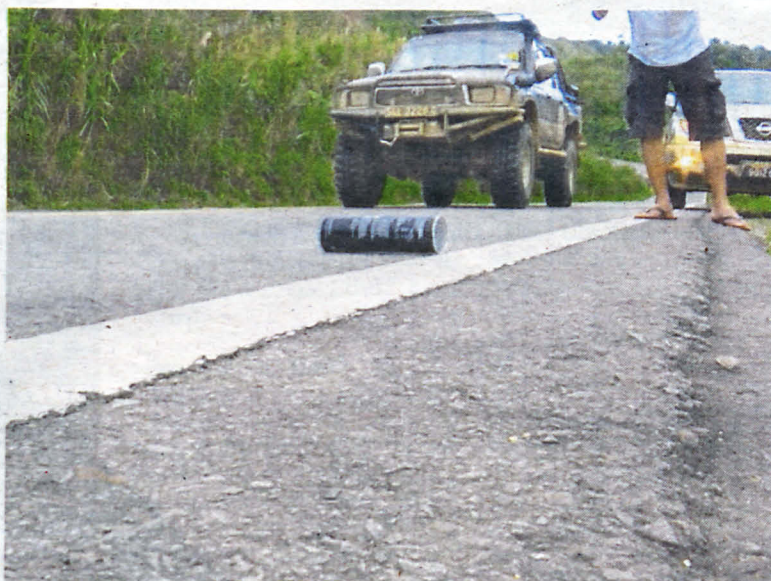
Ujian tarikan graviti turut menggunakan tin berisi air.

Ikuti BH Plus di www.bharian.com.my untuk lebih gambar dan video