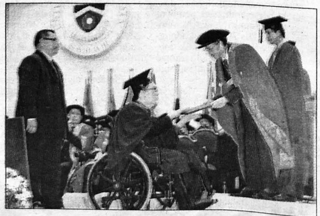
BERSEMANGAT ... Salah seorang graduan dari kalangan pendidik terpaksa disurung menggunakan kerusi roda untuk menerima ijazahnya setelah diserang angin baru-baru ini.

Pada konvokesyen tiga hari itu, UMS mengumiakan ijazah kepada seramai 5,083 orang graduan, termasuk 37 orang penerima Ijazah Doktor Falsafah, 101 orang penerima Ijazah Sarjana Penyelidikan, 456 orang penerima Ijazah Sarjana Kerja Kursus dan 4,486 orang penerima Ijazah Sarjana Muda.