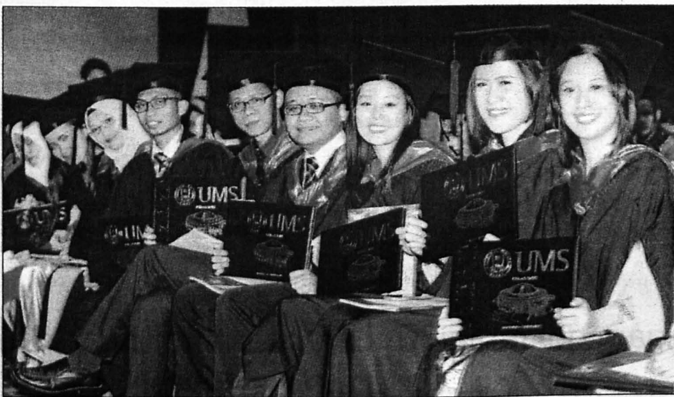
KELAS PERTAMA ... antara graduan yang menerima Ijazah Sarjana Muda Kelas Pertama.

menjadi tanda aras ketamadunan dan ketinggian intelektual masyarakatnya. UMS mampu menghasilkan impak kepada negeri dan negara melalui polemic akademik yang wujud dalam kalangan masyarakat local dan globalnya," katanya.