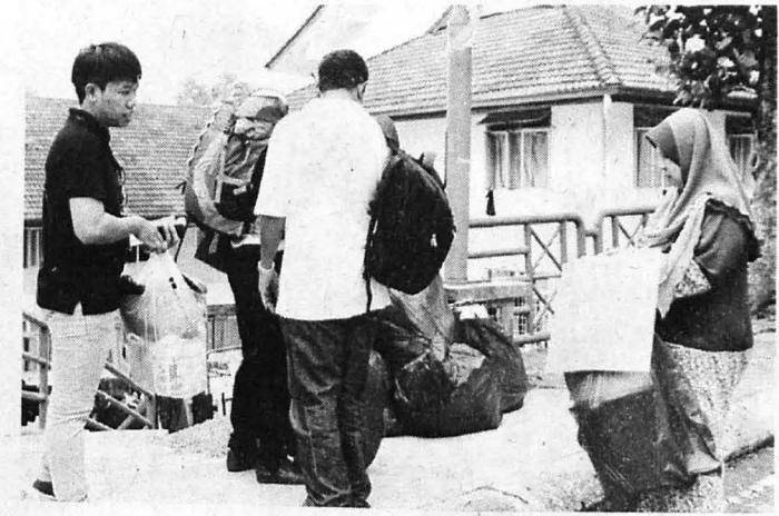
PSM sedang mengiringi pelajar dan ibu bapa ke blok kolej.