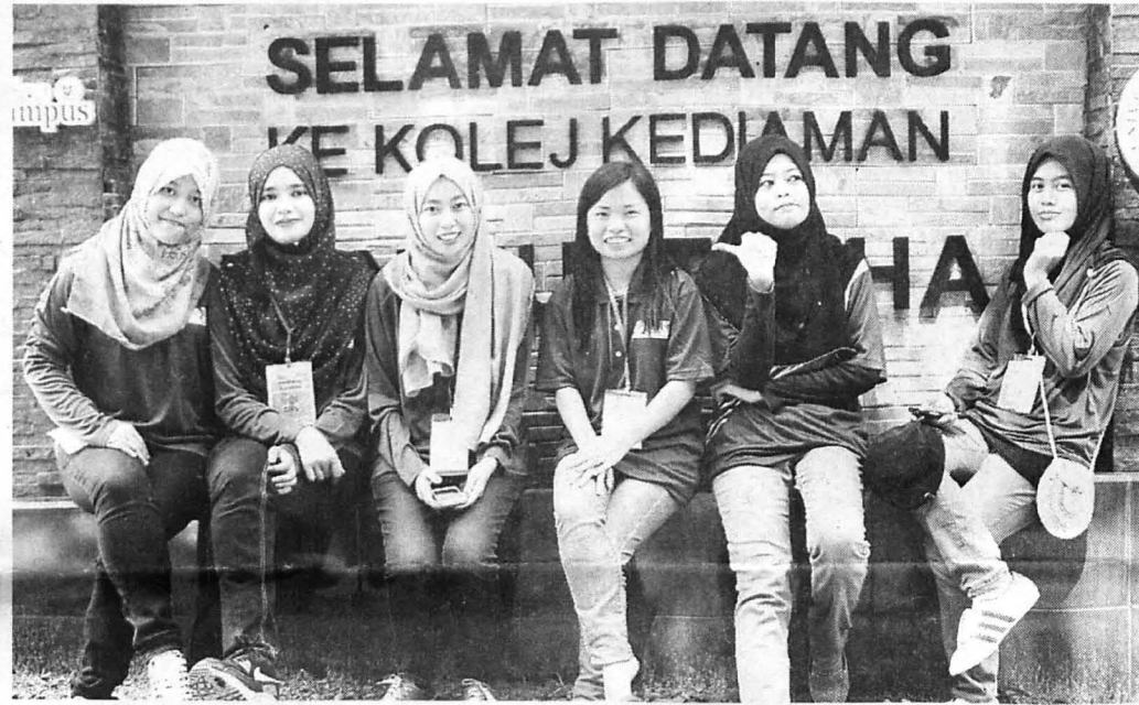
PEMBIMBING Suai Mesra (PSM) Kolej Kediaman Tun Mustapha.

Mereka turut berasa gembira dengan layanan mesra yang diberikan oleh ahli jawatankuasa kolej kediaman dan bersyukur ditempatkan di kolej kediaman ekoran bilik dan perabot yang disediakan amat menyelesaikan pelajar.