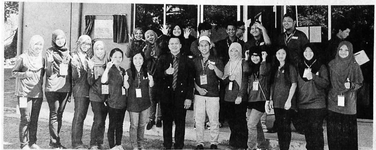
NIZAM bersama barisan ahli jawatankuasa PSM Kolej Kediaman Tun Mustapha.

Kolej Kediaman TM juga turut menempatkan pelajar unit beruniform seperti Suxsi, Palapes Udara, Palapes Darat, Palapes Laut dan Sispa yang turut merencanakan lagi suasana kolej kediaman yang bermottokan, 'Intelektual, Pendidikan dan Identiti'.