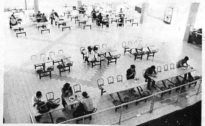
SUASANA kafeteria Kolej TM yang bersih dan kemas.