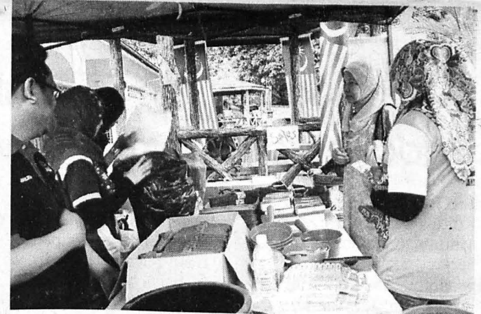
GERAI jualan yang menjual keperluan asas yang dilaksanakan oleh exco keusahawanan Kolej Tun Mustapha.