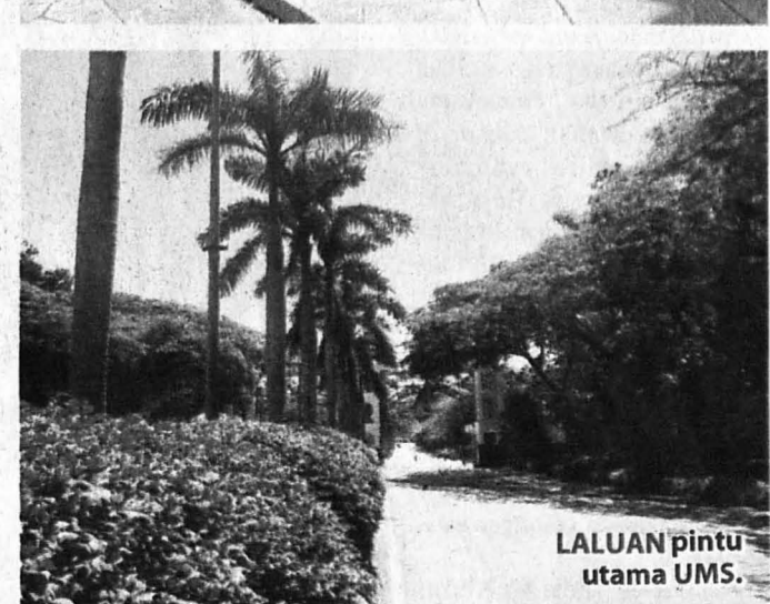
LALUAN pintu utama UMS.