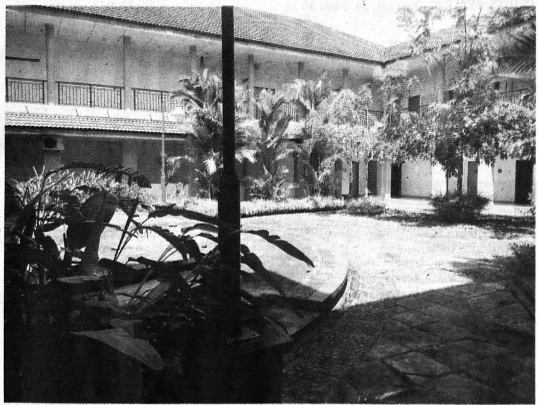
REKAAN Landskap Sekolah Seni(FKSW).