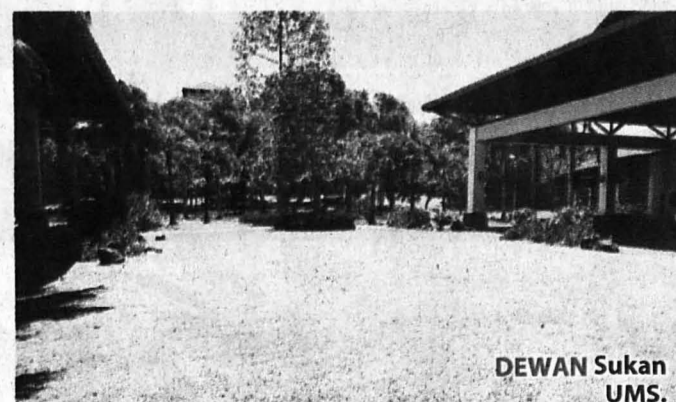
DEWAN Sukan UMS.