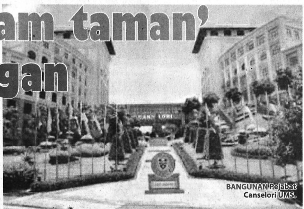
BANGUNAN Pejabat Canselori UMS.

Katanya, kali pertama datang ke UMS, dia sangat kagum dengan landskap universiti itu kerana persekitarannya dikelilingi oleh pokok-pokok serta bunga-bunga yang cantik. "Ya tidak membosankan kerana banyak tempat boleh