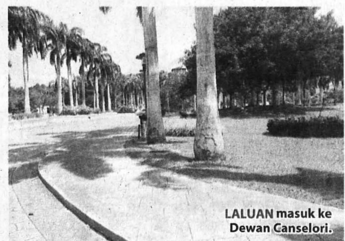
LALUAN masuk ke Dewan Canselori.