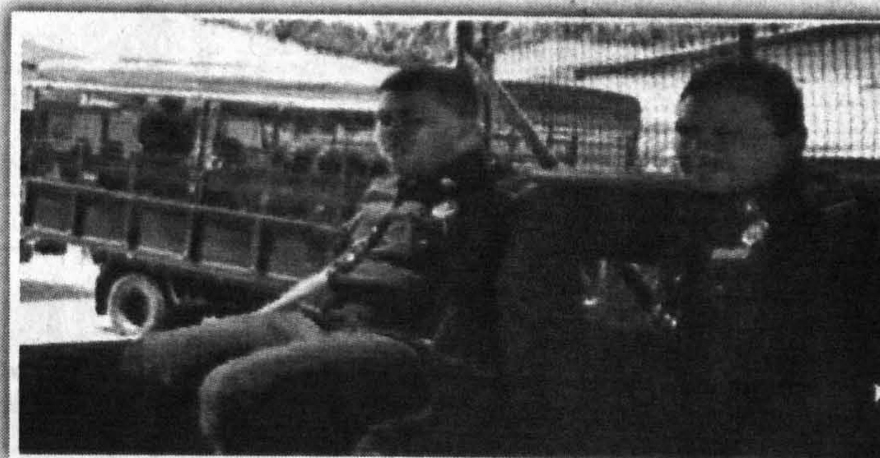
POLIS... Antara anggota polis yang bertugas semasa latihan itu.