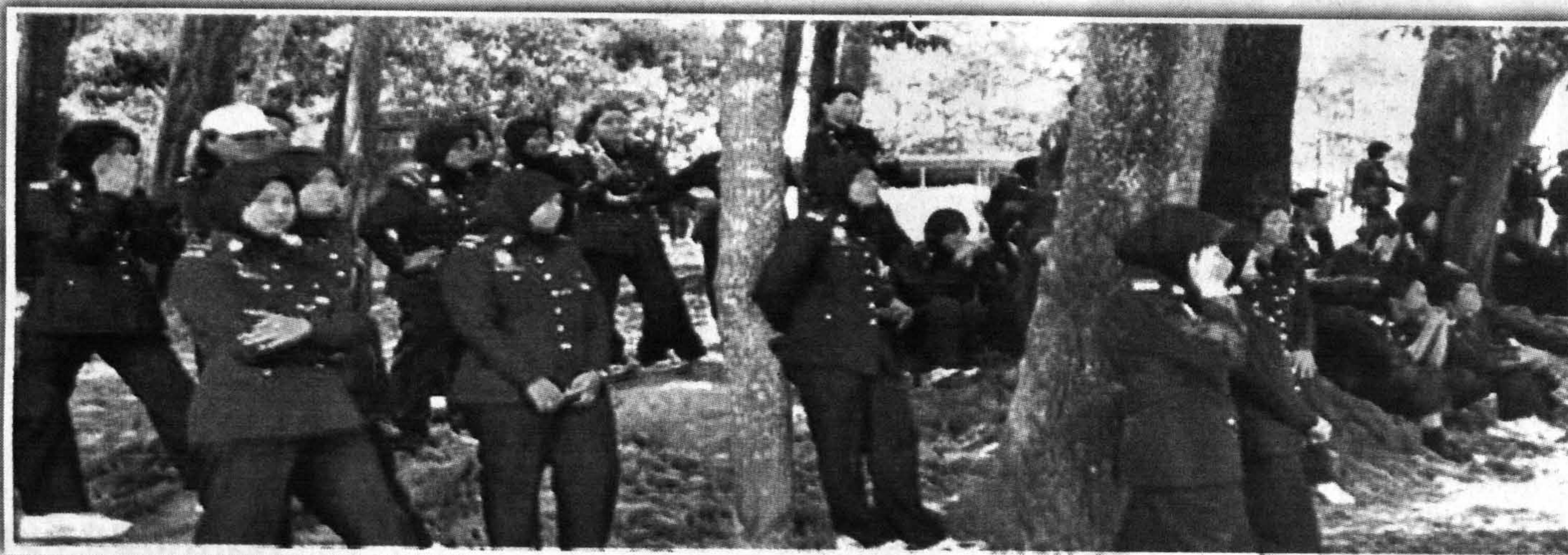
TURUT SERTA... Sebahagian pelatih Kor-suksis yang terlibat dalam aktiviti latihan menembak.

Beliau menjelaskan, ia adalah program tahunan bagi Suksis dan semasa latihan itu, Timbalan Naib Canselor Hal Ehwal Pelajar