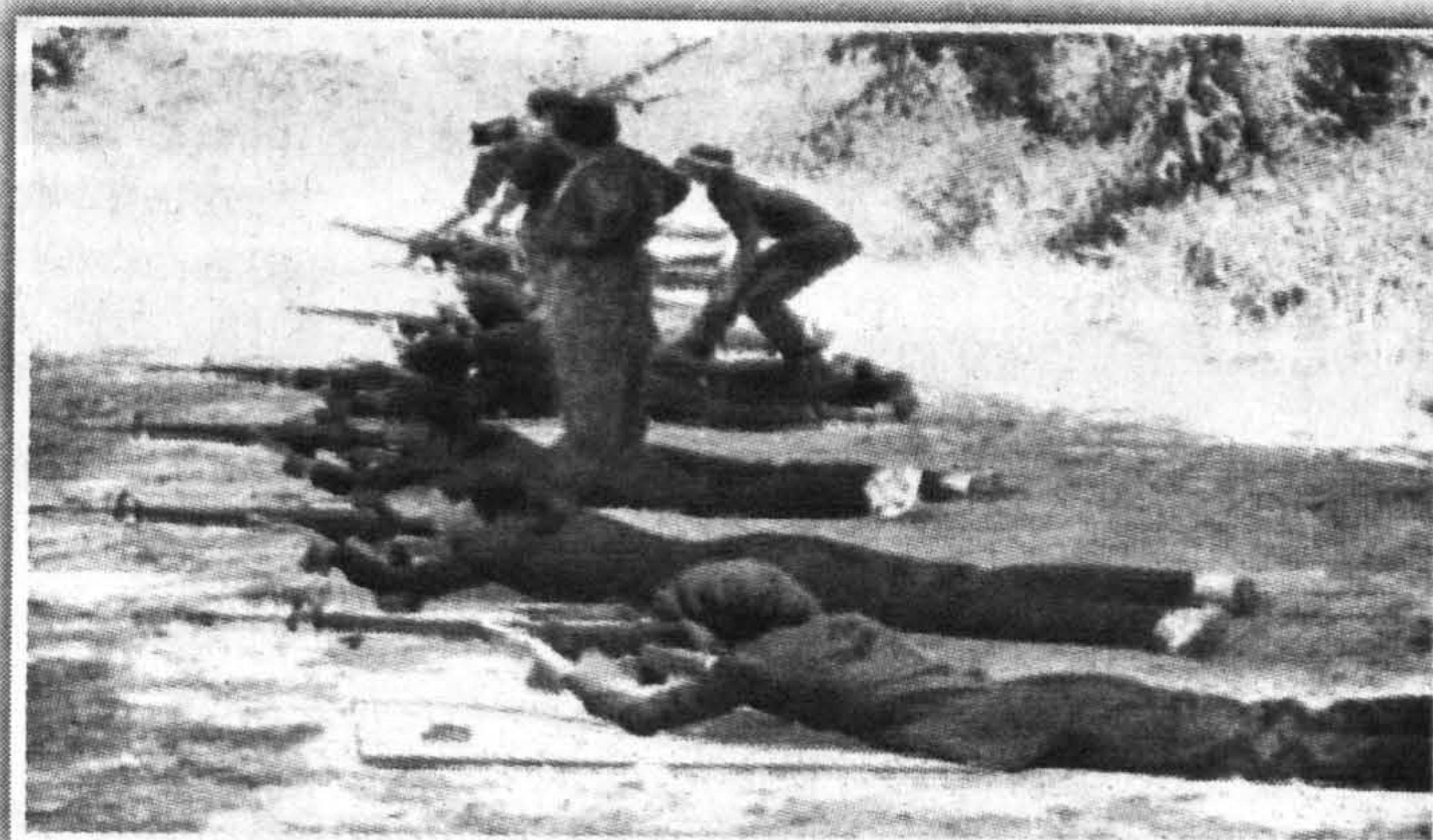
TEKNIK... Teknik menembak meniarap antara teknik yang diajar kepada pelatih.