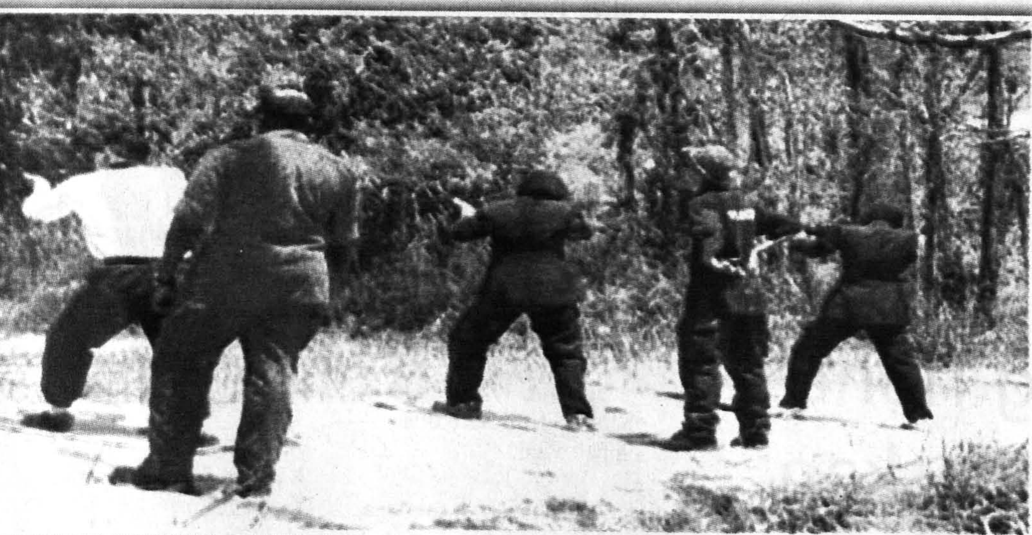
TEMBAK... Teknik menembak berdiri turut diajar oleh petugas.

Kesemua pelatih menunjukkan kepuasan dan keseronokan mengikuti latihan berkenaan tanpa berlaku sebarang kecuaiian yang tidak diinginkan dan berharap pada masa akan datang mereka berpeluang lagi untuk menyertainya.