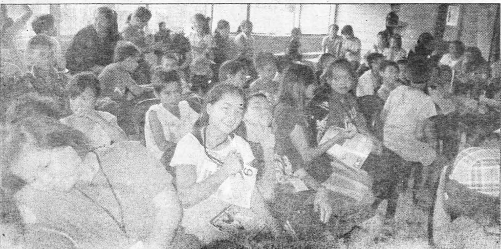
MURID-murid SK. Rompon yang mengikuti Program Outreach UMS.