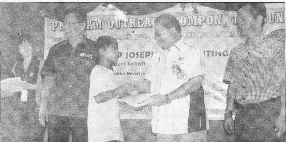
PAIRIN menyampaikan sijil kepada wakil peserta murid SK. Rompon yang mengikuti program itu.

Hadir sama Pemimpin Kemajuan Rakyat (PKR) Tambunan, Ketua-Ketua Jabatan dan pemimpin-pemimpin masyarakat.