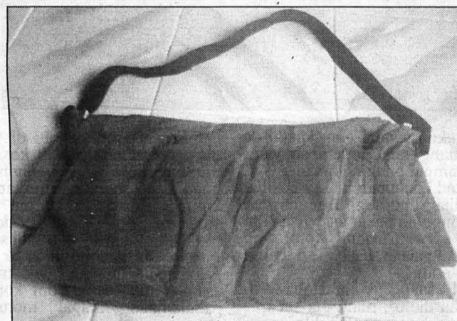
BAJU hujan diinovasikan menjadi dua fungsi di mana telah diubah menjadi beg dan dalam masa yang sama, boleh dipakai sebagai baju hujan.

Usahawan pula merupakan golongan yang mereka cipta dan