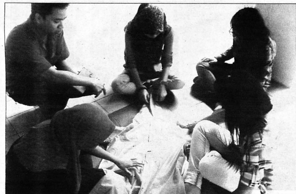
BINCANG .... Sesi perbincangan dalam kumpulan sebelum mengambil sesuatu keputusan bagi membincangkan jenis produk yang dihasilkan.

Sebagai kesimpulannya, kumpulan ini bersetuju bahawa bidang keusahawanan adalah aktiviti yang mampu menjana pemikiran yang tinggi serta semangat juang yang kuat agar mampu menghasilkan produk yang belum pernah wujud di pasaran dan mampu menarik masyarakat untuk mengenali produk tersebut dan mahu memilikinya.