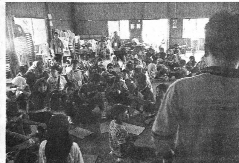
PROGRAM LDK bersama murid-murid di SK Tambisan.