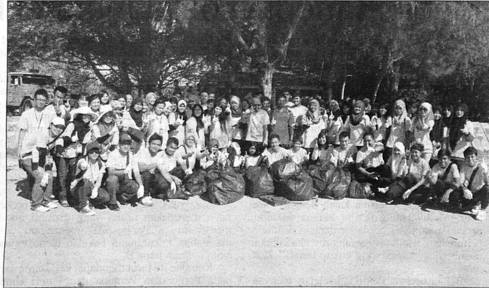
GÖTONG ROYONG... sebahagian pelajar IPTA yang menyertai kerja-kerja pembersihan pantai 1MG1MC di pantai Tanjung Purun, kelmarin.