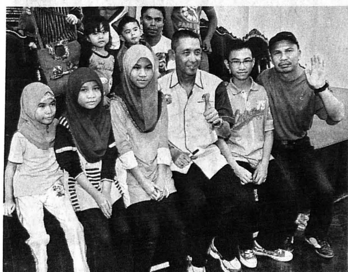
PEMINAT kecil tidak mahu melepaskan peluang bergambar dengan Misbun.