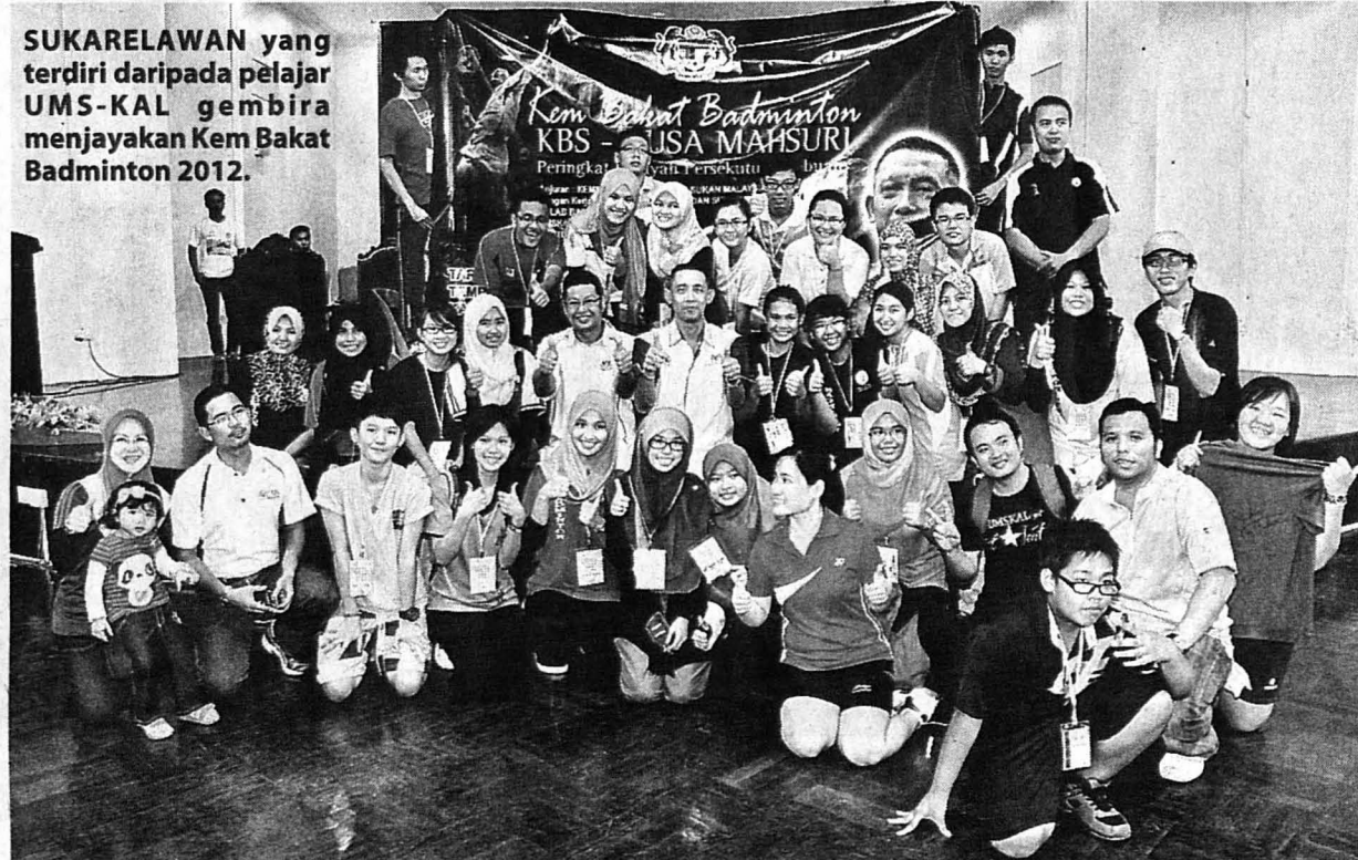
SUKARELAWAN yang terdiri daripada pelajar UMS-KAL gembira menjayakan Kem Bakat Badminton 2012.