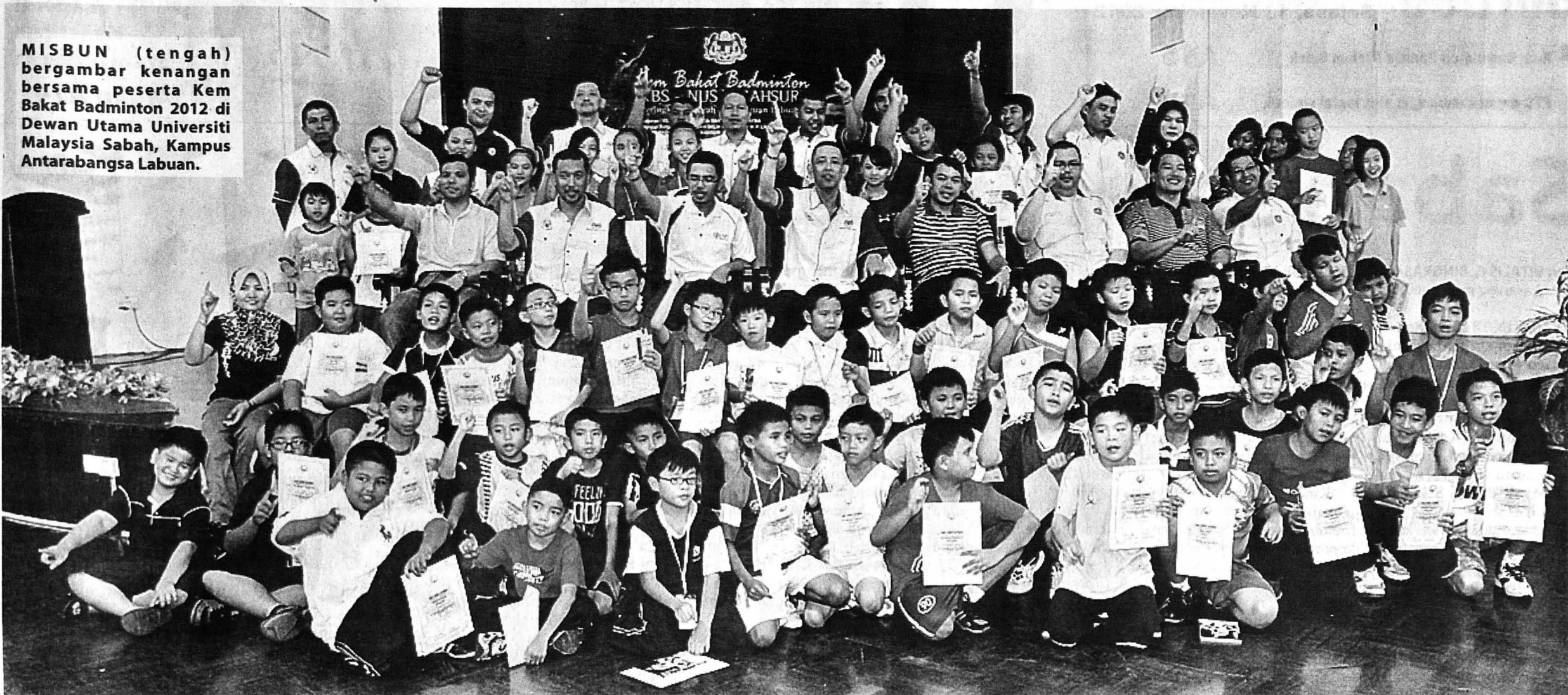
MISBUN (tengah) bergambar kenangan bersama peserta Kem Bakat Badminton 2012 di Dewan Utama Universiti Malaysia Sabah, Kampus Antarabangsa Labuan.