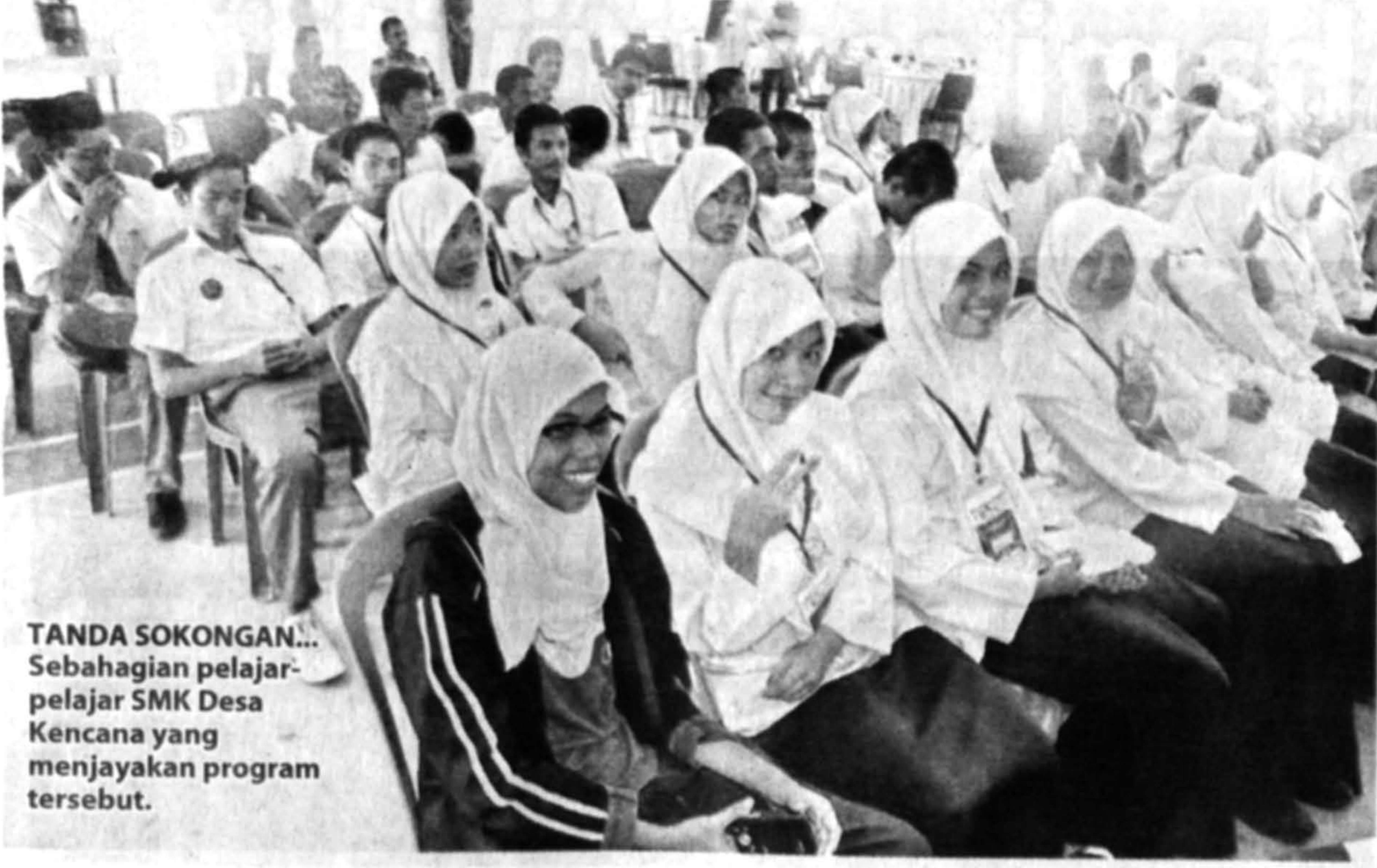
TANDA SOKONGAN... Sebahagian pelajar-pelajar SMK Desa Kencana yang menjayakan program tersebut.