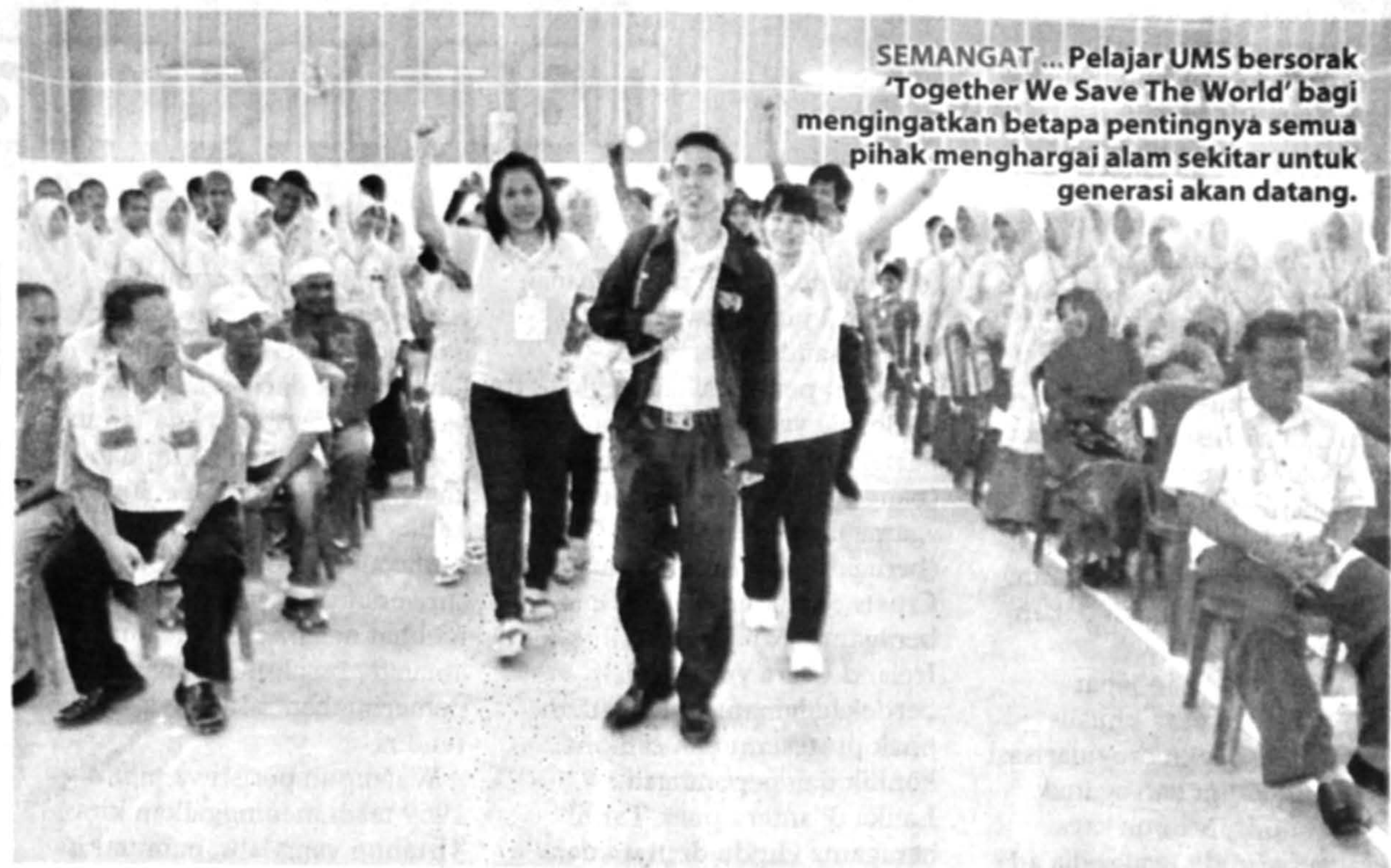
SEMANGAT ... Pelajar UMS bersorak 'Together We Save The World' bagi mengingatkan betapa pentingnya semua pihak menghargai alam sekitar untuk generasi akan datang.