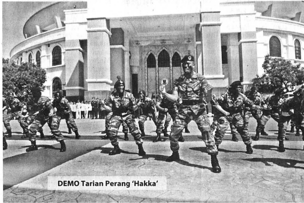
DEMO Tarian Perang 'Hakka'