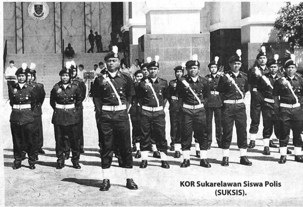
KOR Sukarelawan Siswa Polis (SUKSIS).

juga terdiri daripada tiga komponen iaitu PALAPES Darat, Laut dan juga Udara, Kor Sukarelawan Siswa Polis (SUKSIS), Kor Siswa-Siswi Pertahanan Awam (SISPA), serta Bomba dan Penyelamat.