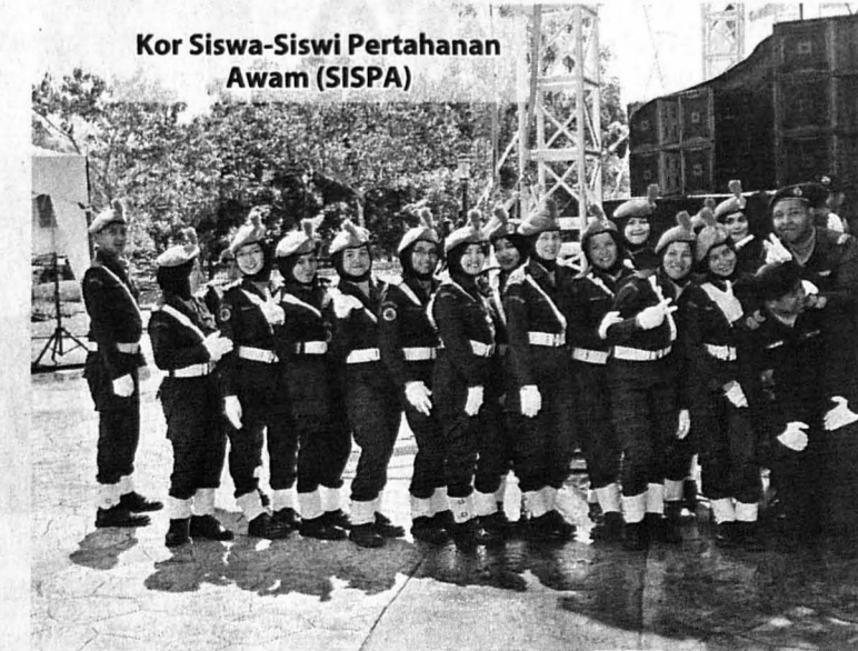
Kor Siswa-Siswi Pertahanan Awam (SISPA)