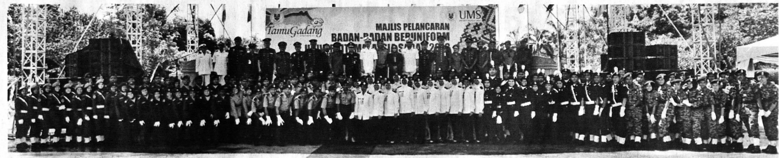
GAMBAR Kenangan unit beruniform UMS.