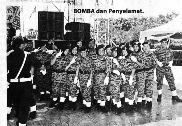
BOMBA dan Penyelamat.