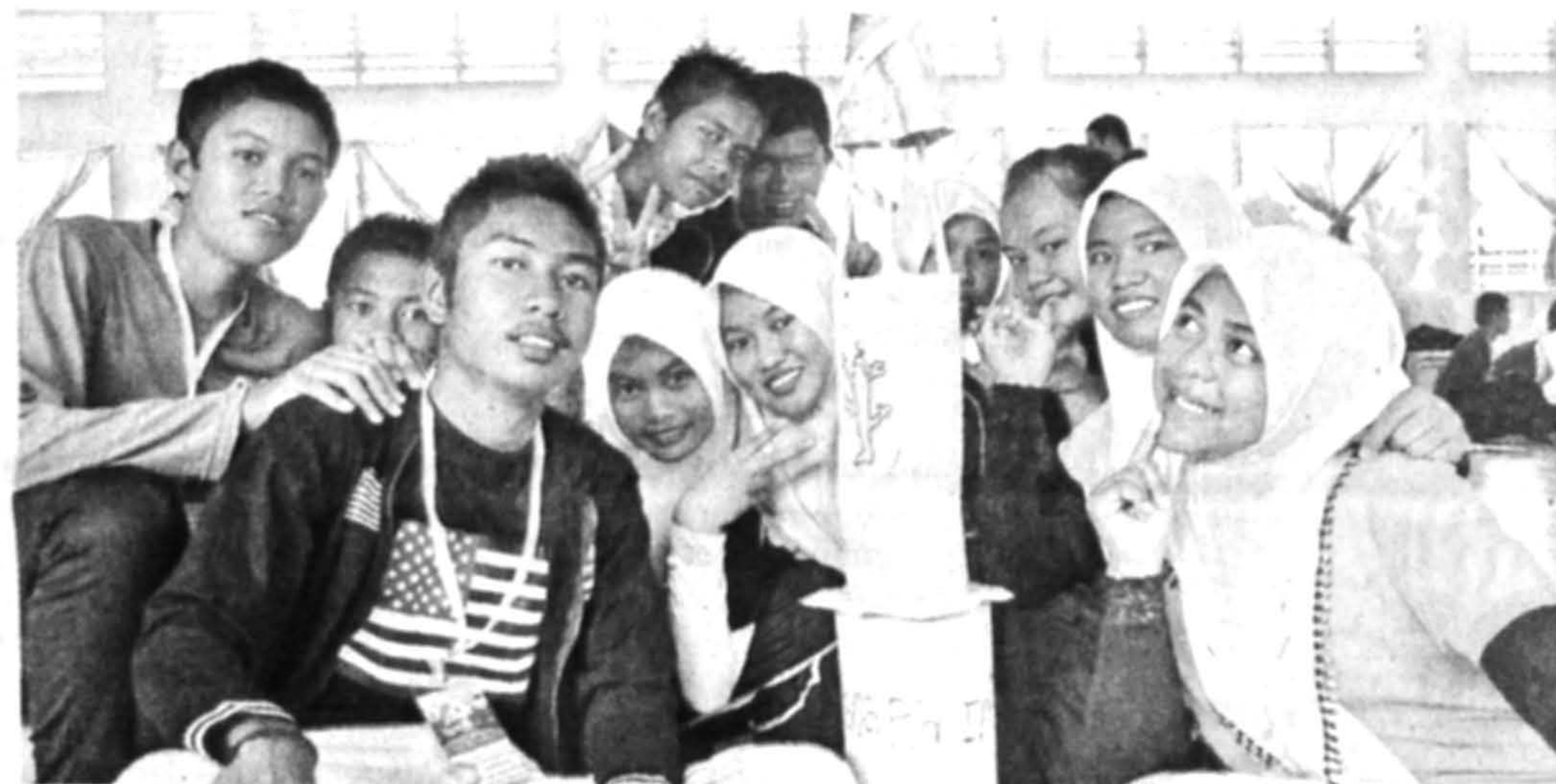
DARI KAMPUS & SEKOLAH UTUSAN BORNEO

(Gambar bawah) KHUSYUK ... Semua peserta menumpukan perhatian ketika sidang ceramah.