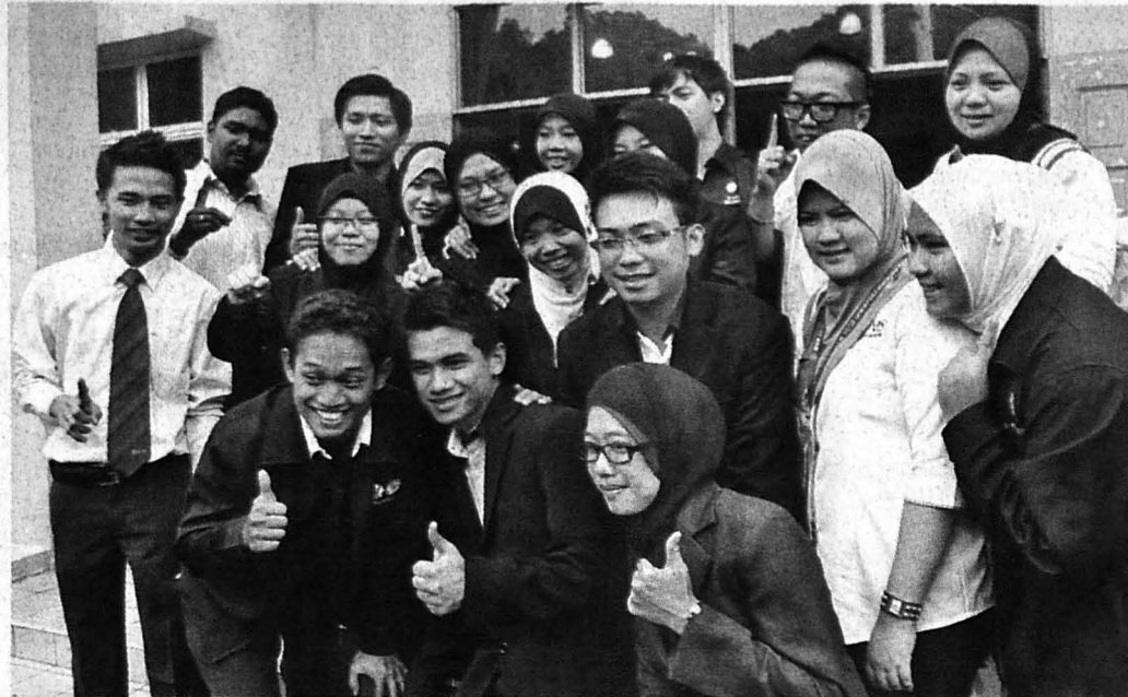
BERSAMA kepimpinan MPPUMS Sesi 2012/2013.

satu penanda aras dalam memastikan hala tuju yang dibawa berjaya dicapai.