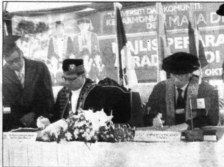
TANDATANGANI ... Mayor dan Naib Canselor UMS menandatangani skrol.