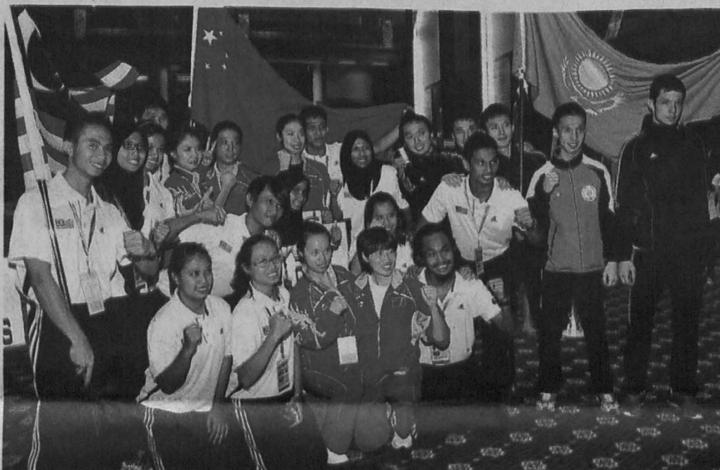
ATLET Malaysia dan China merakamkan gambar kenangan.