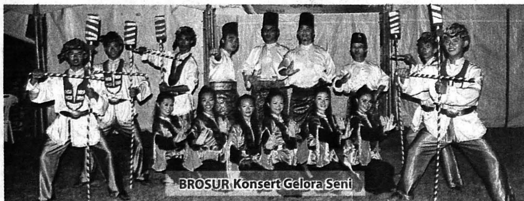
BROSUR Konsert Gelora Seni