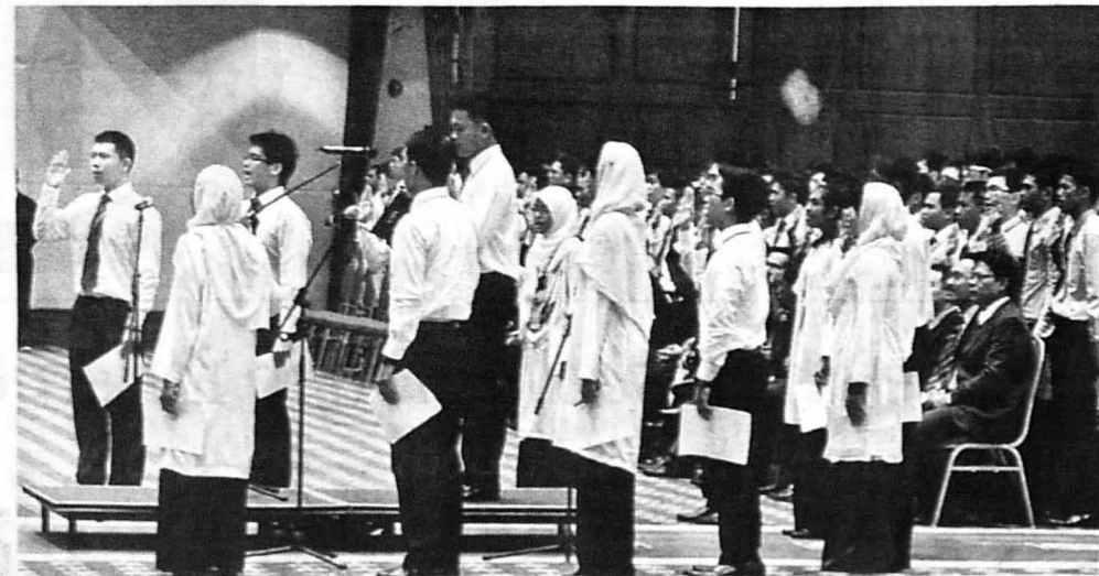
PARA pelajar membacakan ikrar Aku Janji Mahasiswa Baru UMS.

"Segala pengalaman yang ditimba di universiti akan membentuk sahsiah diri selain mengecapi kejayaan yang pasti jika memberikan tumpuan dan perhatian kepada bidang pengajian yang diceburi," ujarnya.