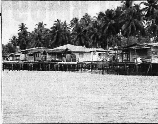
PULAU Omadal, Semporna dipilih sebagai subjek dan latar dokumentari.