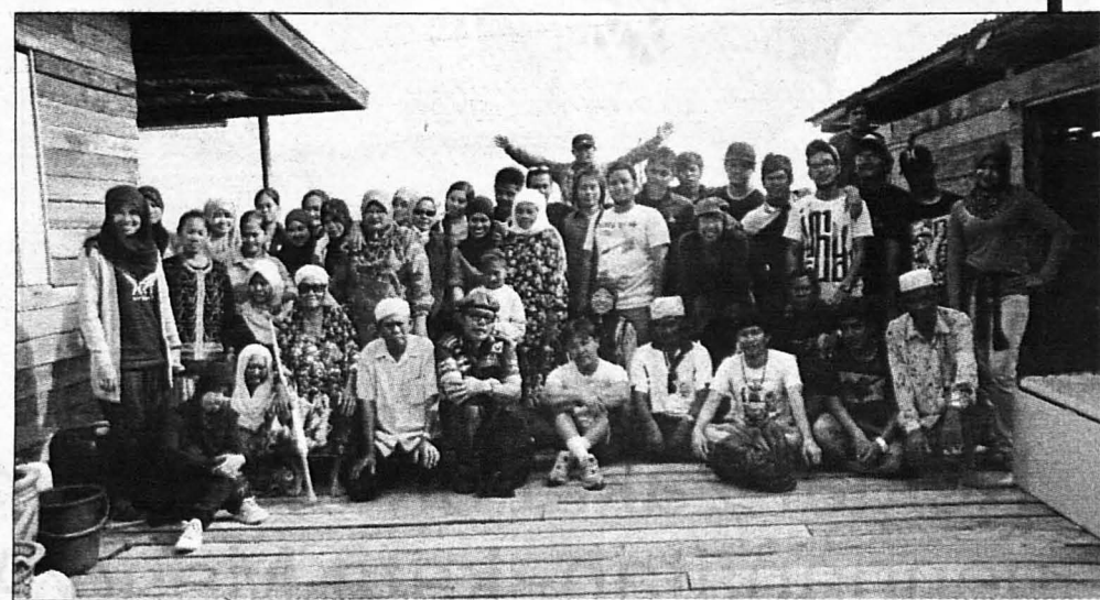
TENAGA ... Tenaga Krew Produksi melibatkan para pensyarah dan pelajar Sekolah Pengajian Seni

Pembikinan dokumentari yang dilakukan di Pulau Omadal, Semporna Sabah selama seminggu itu pada April lalu turut melibatkan para pelajar Seko-