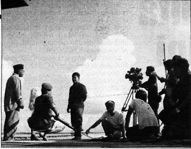
RAKAMAN ... Rakaman penggambaran dokumentari sedang dilakukan.