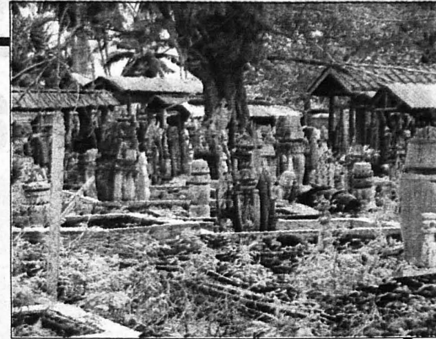
BATU NIASAN ... Batu Nesan atau Sunduk suku kaum Bajau yang juga dijadikan bahan kajian.