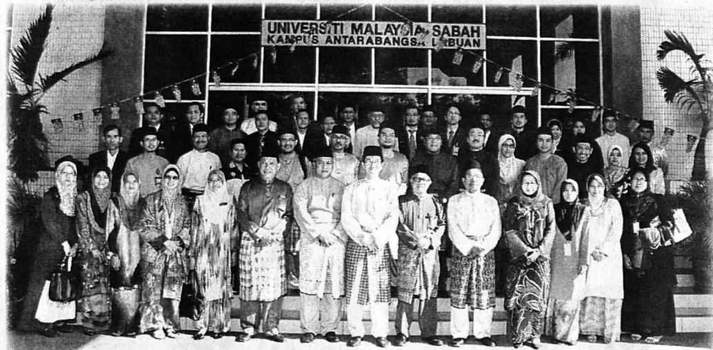
(Gambar kiri) Pegawai kanan UMS yang menghadiri Mesyuarat Pagi UMS kali ke-155.

kakitangan dan majlis terbuka puasa bersama kakitangan UMS-KAL.