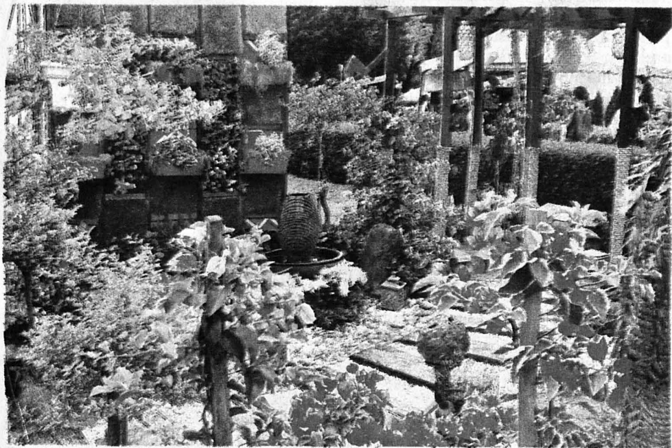
SUSUNAN bunga dan pergola yang rapi.

Oleh ABD.NADDIN HJ.SHAIDDIN abdnaddin@yahoo.com 06 13 07 2012 B1