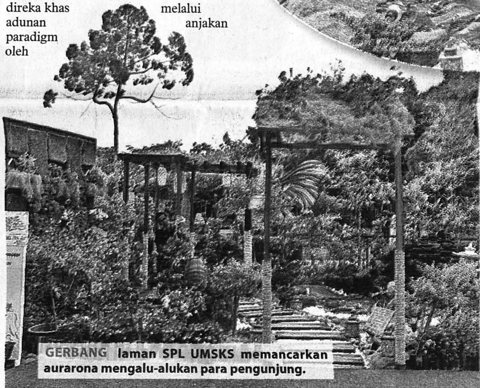
GERBANG laman SPL UMSKS memancarkan aurora mengalu-alukan para pengunjung.