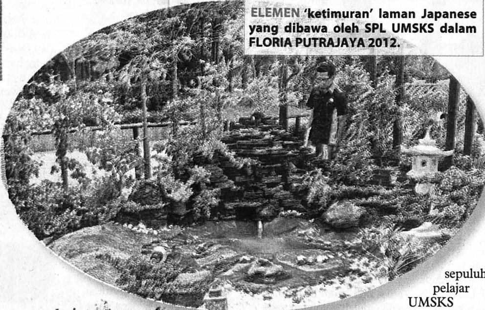
ELEMEN 'ketimuran' laman Japanese yang dibawa oleh SPL UMSKS dalam FLORIA PUTRAJAYA 2012.