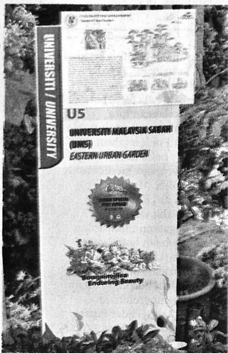
KONSEP dan rekabentuk laman 'Urban Eastern Garden' yang di persembahkan oleh SPL UMS.