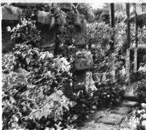
SUSUNAN ton dan tekstur warna yang harmoni selari dengan tema FLORIA PUTRAJAYA 2012 - 'Bunga Kertas Tetap Menawan'.