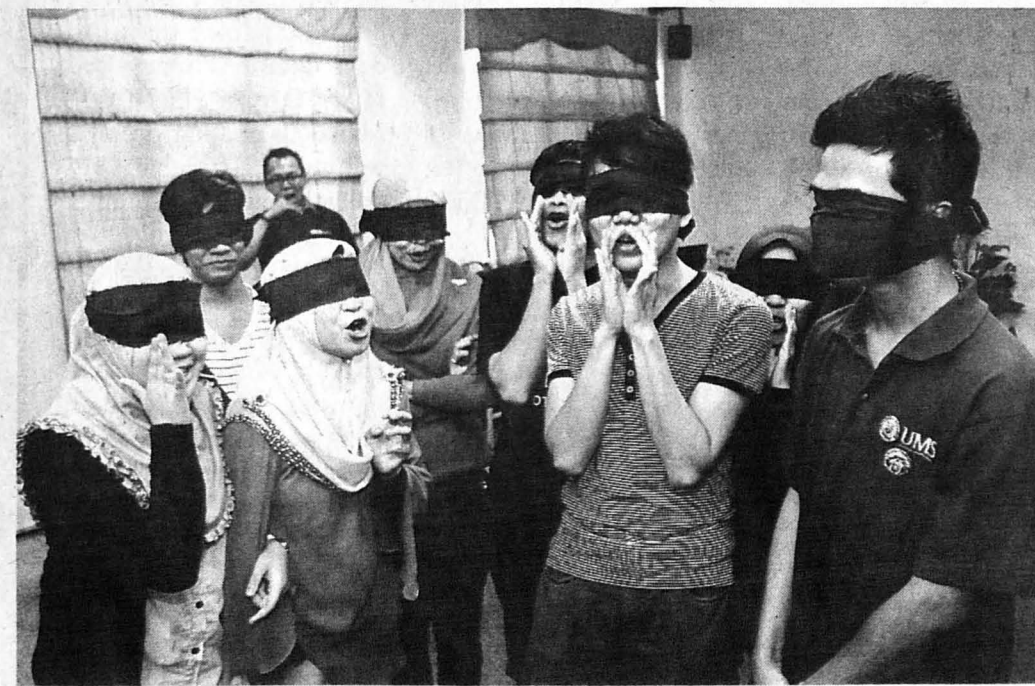
PARA peserta mengambil bahagian dengan penuh minat dalam setiap aktiviti yang dilaksanakan