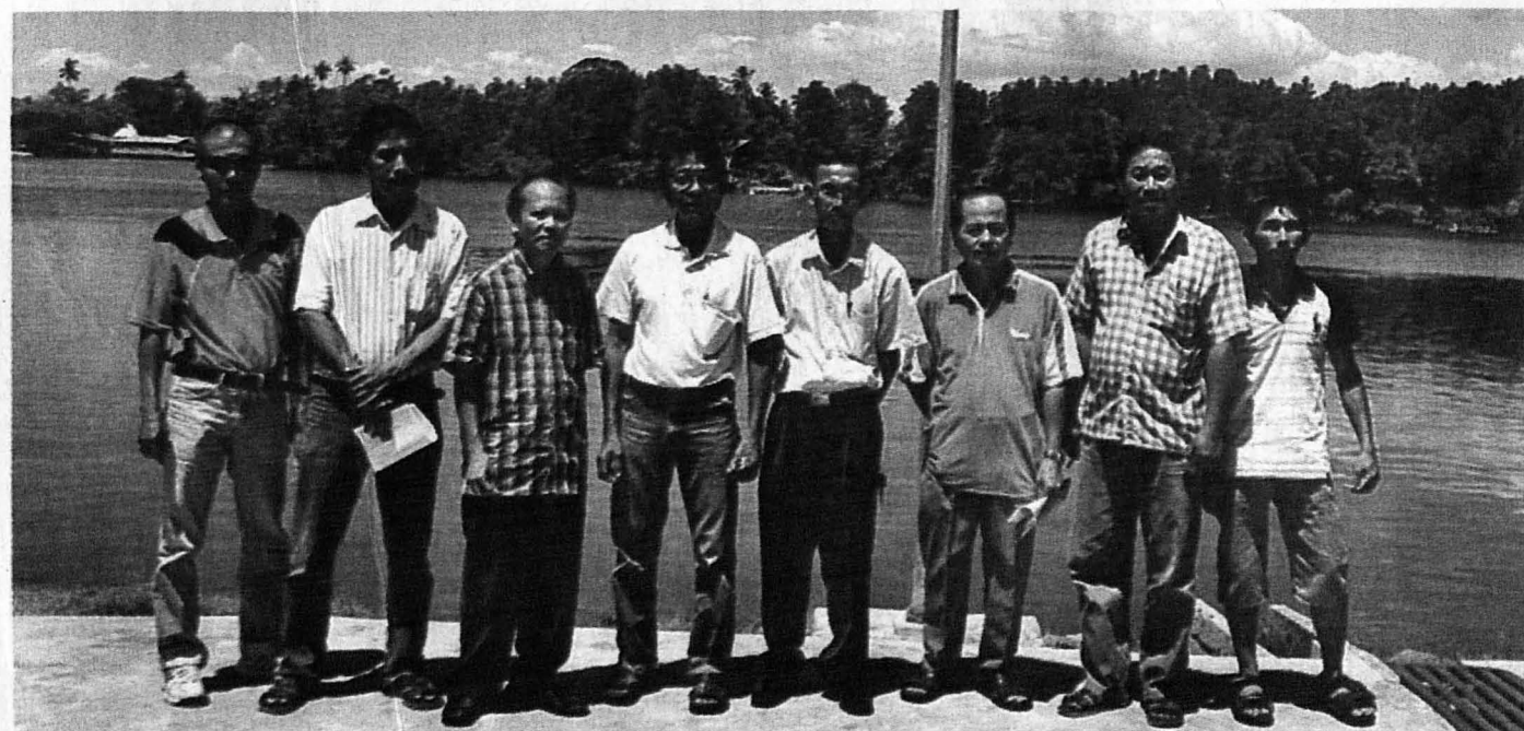
BEBERAPA nelayan Kuala Penyu yang mempertahankan tempat menangkap ikan mereka.

"Jumlah pendaratan nelayan tradisi sangat tinggi tetapi nilai borong hanyalah sebanyak RM9, 065.89 ('000) berbanding dengan nilai runcit RM 22,145.08. Kenapa harga borong lebih rendah dari harga runcit ikan? Jawapannya mudah; ikan adalah makanan yang mudah rosak (busuk), maka