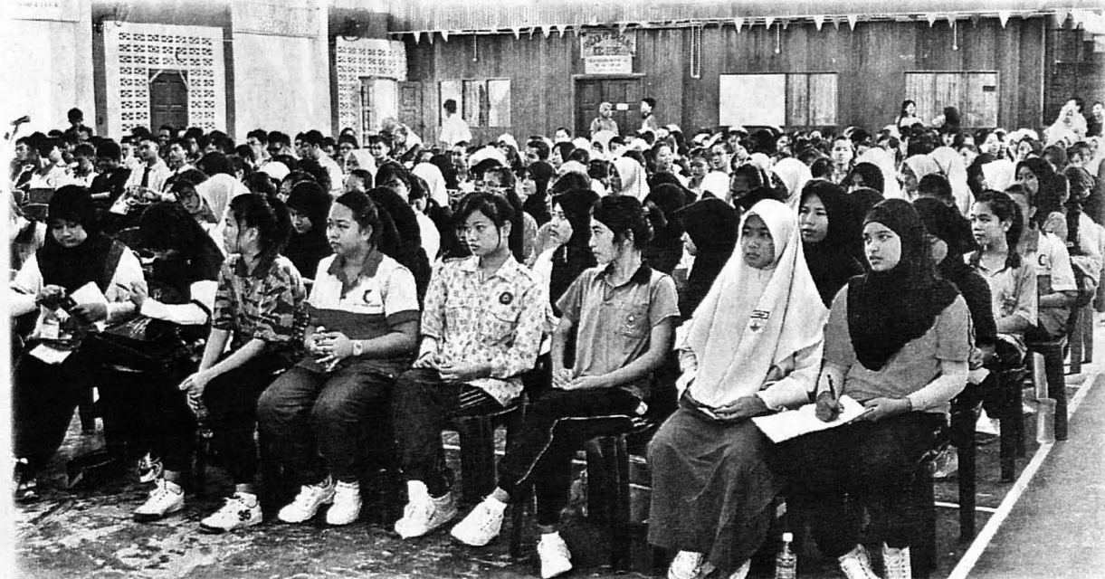
SEBAHAGIAN daripada peserta majlis seminar motivasi SMK Abdul Rahim, Kudat.