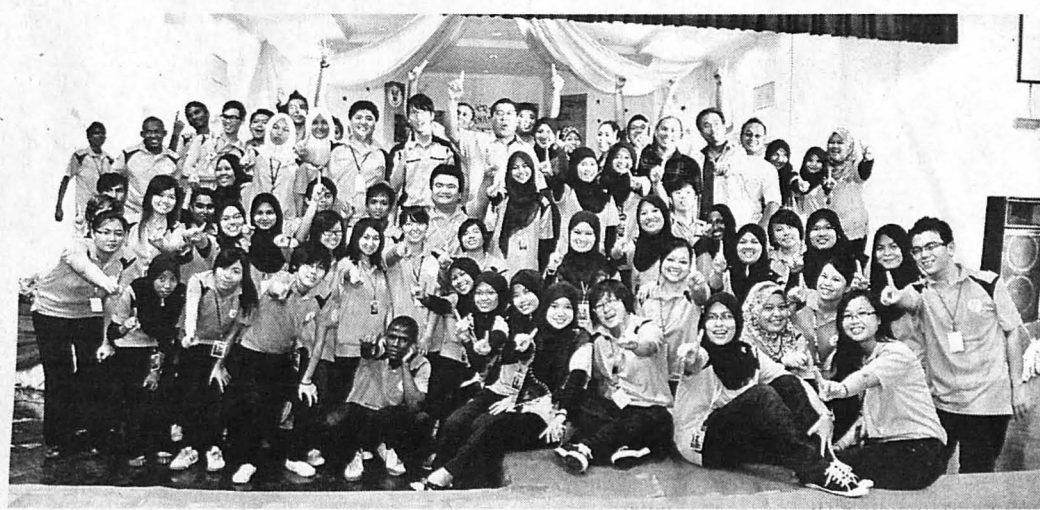
AHLI Jawatankuasa Pelaksana Karnival Kokurikulum UMS-KAL Semester Dua Sesi 2011/2012 bergambar kenangan dengan tetamu kehormat.

Beliau berkata penglibatan semua pelajar kokurikulum dalam karnival ini adalah wajib dan penilaian akan dibuat oleh semua tenaga pengajar dan