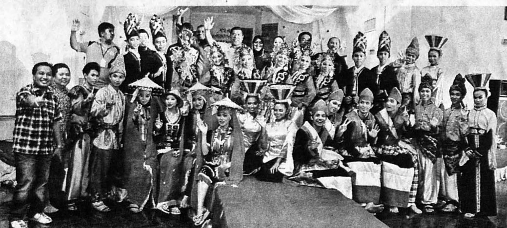
KUMPULAN tarian yang menyertai pertandingan tarian etnik Sabah dan Sarawak.