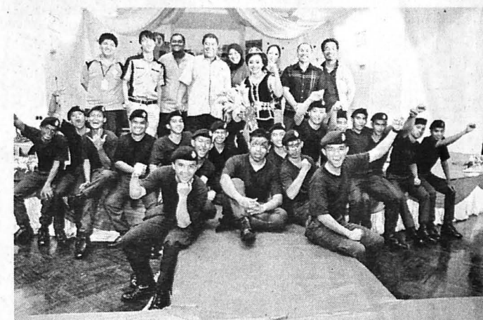
KUMPULAN Palapes muncul johan pertandingan Hakka.