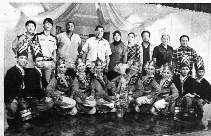
KUMPULAN tarian SMK Pantai muncul naib johan. (gambar atas)