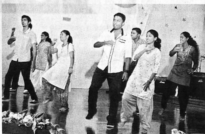
PERSEMBAHAN tarian pelajar India menggamatkan Dewan Utama UMS-KAL.