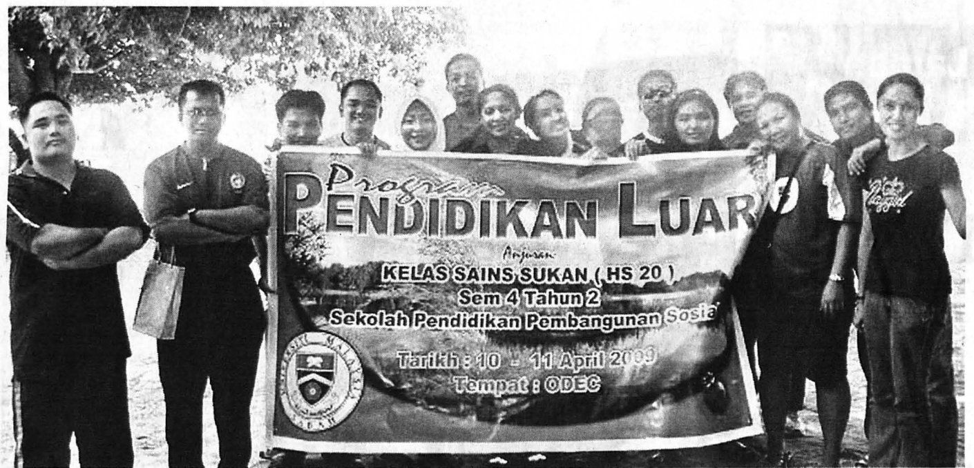
KEM pendidikan luar di UMS telah bermula seawal tahun 2007.

Negara maju seperti Amerika Syarikat, Great