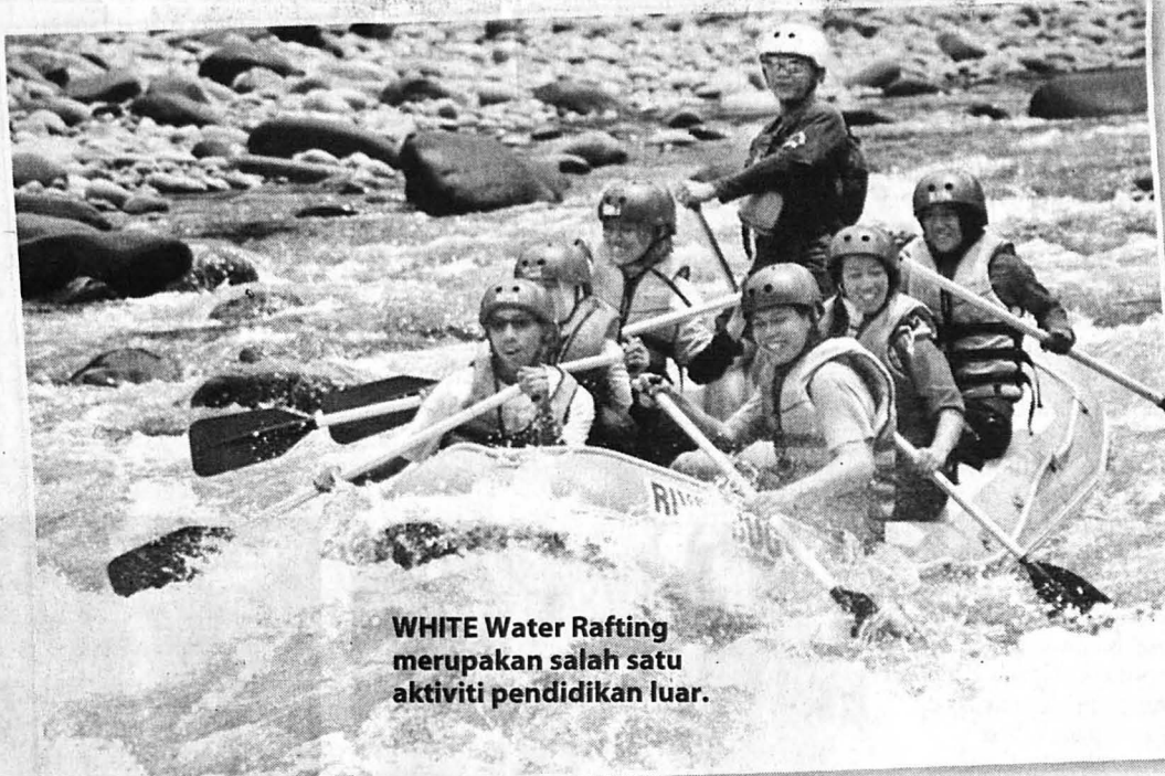
WHITE Water Rafting merupakan salah satu aktiviti pendidikan luar.

“Pelaksanaan aktiviti lasak yang melibatkan alam semulajadi seperti berkayak, mendaki gunung dan berenang sebagai medium membina kemahiran insaniah menjadi faktor lebih ramai pelajar berminat menceburi bidang pendidikan luar sama ada secara langsung mahupun tidak langsung kerana tidak melibatkan tahap kemahiran dan kecergasan fizikal yang tinggi. Akibatnya, pelbagai lapisan pelajar yang berbeza tahap kecergasan fizikal dan mental menyertai program pendidikan luar berbanding pelajar yang menyertai acara sukan.”