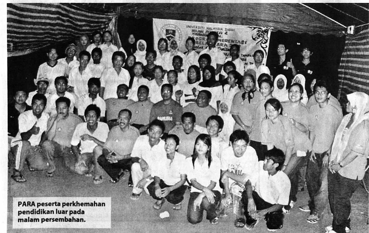
PARA peserta perkhemahan pendidikan luar pada malam persembahan.

Pendidikan luar mampu membangunkan potensi kepimpinan individu dan perkhemahan yang dijalankan turut membantu untuk memupuk semangat perpaduan dalam kalangan peserta selain berkesan dalam melahirkan generasi yang cemerlang seiring dengan matlamat dan meminimakan gejala yang tidak sihat.