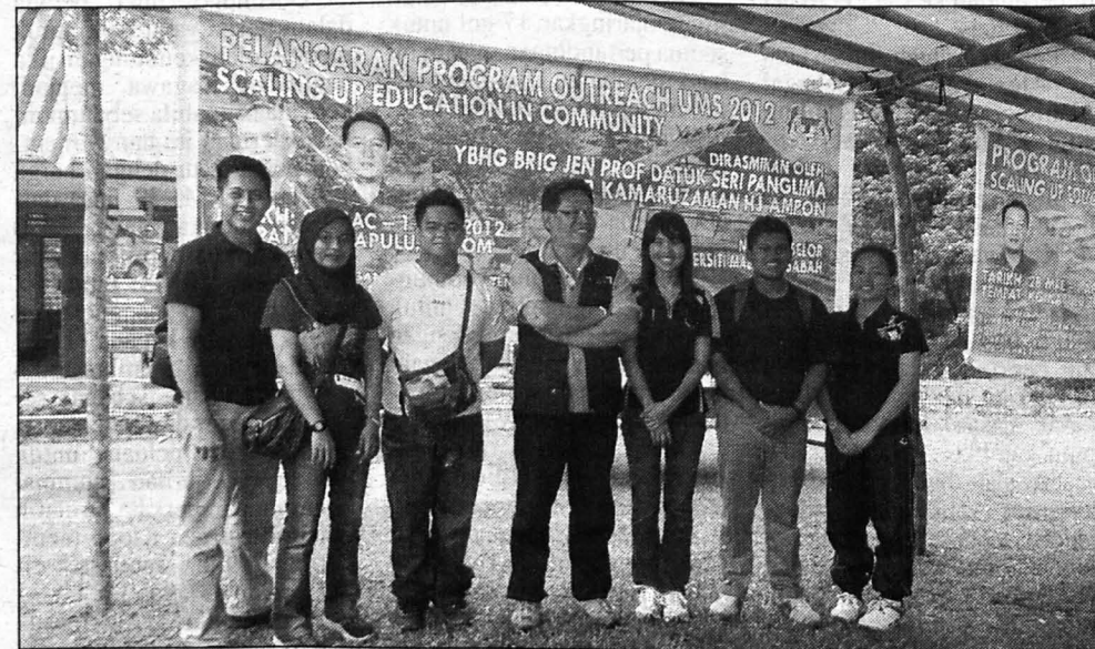
PENCARIAN ... Antara pelajar Sains Sukan UMS yang terlibat dalam program pencarian bakat sukan di kawasan pedalaman.