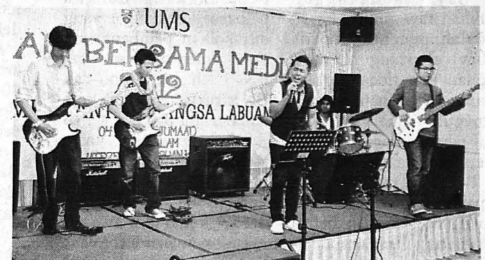
PERSEMBAHAN pelajar memeriahkan Malam Penghargaan UMS-KAL Bersama Media 2012 di Hotel Waterfront, malam kelmarin.

Bagaimanapun, beliau mengharapkan pihak media tidak menghubungi mahasiswa atau kakitangan bagi mendapatkan maklumat berkaitan universiti tetapi sebaliknya menghubungi beliau atau Zamri bagi mengelak maklumat berkenaan tidak benar