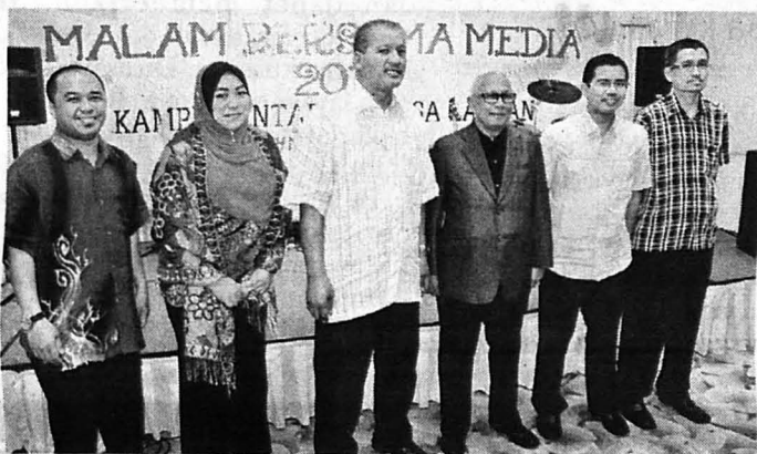
KAKITANGAN Jabatan Penerangan merakam kenangan bersama Pengarah UMS-KAL (tiga kanan).