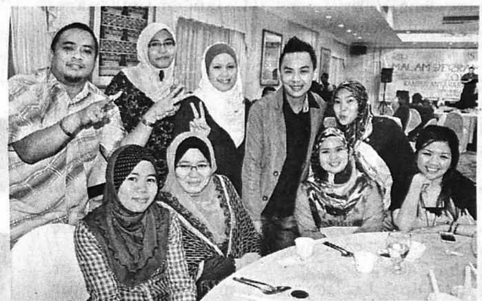
AHLI Jawatankuasa Pelaksana Penghargaan UMS-KAL Bersama Media 2012.

dan kurang tepat sehingga menjejaskan nama dan imej universiti.