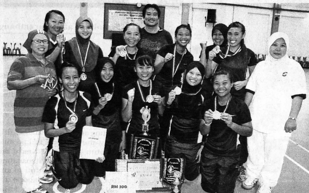
JUARA kategori IPTA / Sekolah dimenangi pasukan MSS Wilayah Persekutuan Labuan.