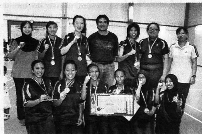
PASUKAN SMK Labuan menduduki tempat ketiga.