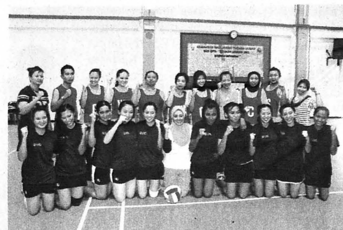
KB STRIVER'S (berdiri) bergambar bersama UMS sebelum perlawanan akhir kategori terbuka.