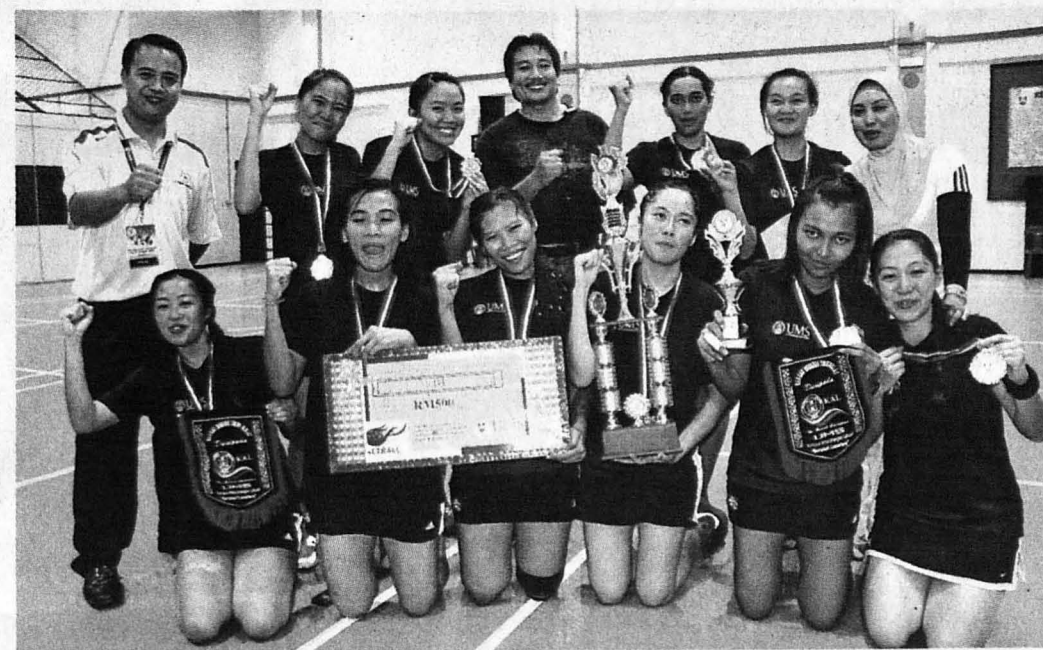
PASUKAN UMS juara kategori terbuka Kejohanan Bola Jaring UMS-KAL 2012.