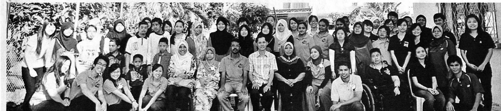
PELAJAR UMS-KAL bergambar kenangan bersama pelatih di PDK Jalan Tenaga Labuan.