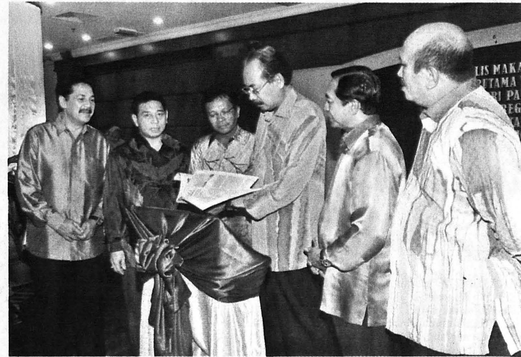
TUN Juhar melancarkan buku UMS bertajuk 'Pulau Mabul: Dulu, Kini dan Masa Depan'.

LEPA UMS menonjolkan dekorasi dan seni ukir etnik Bajau Semporna.